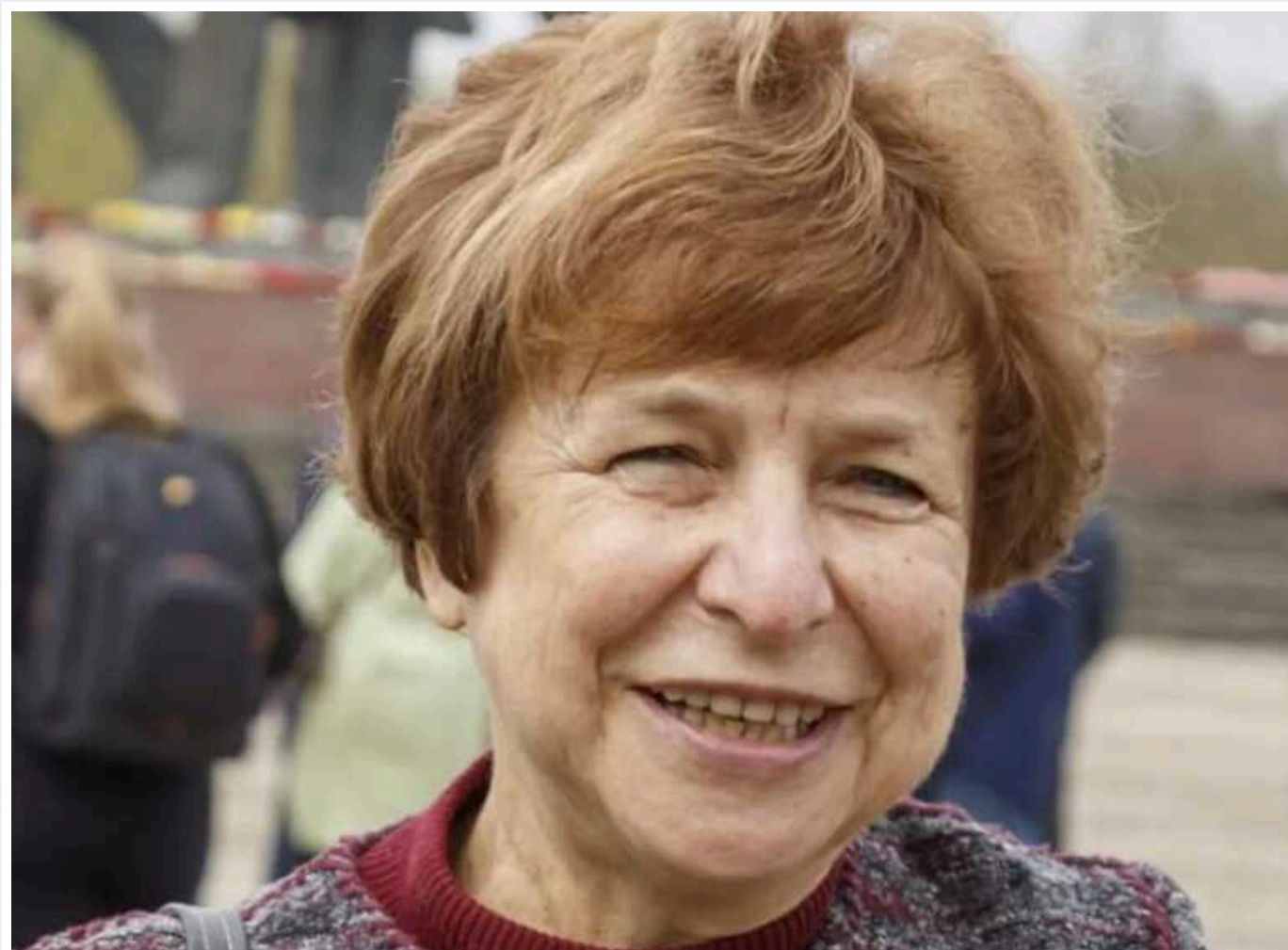
Латвійська депутатка Європарламенту виявилась агентом розвідки РФ: у неї було два куратори, – The Insider

Депутатка Європейського парламенту Тетяна Зданока виявилась агентом російської розвідки і в період з 2004 по 2017 рік підкорялася двом різним кураторам із країни-агресора. Політичниця довгі роки відкрито захищала інтереси Москви як у Ризі, так і у Страсбурзі.