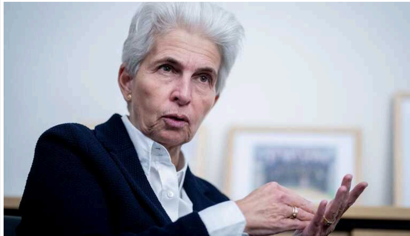
Німецький Бундестаг висловлює невдоволення французькою підтримкою України: "Багато слів, мало зброї"

Німці висловлюють невдоволення з приводу французької риторики на підтримку України, стверджуючи, що зброя, що фактично поставляється, не відповідає заявленим обіцянкам.