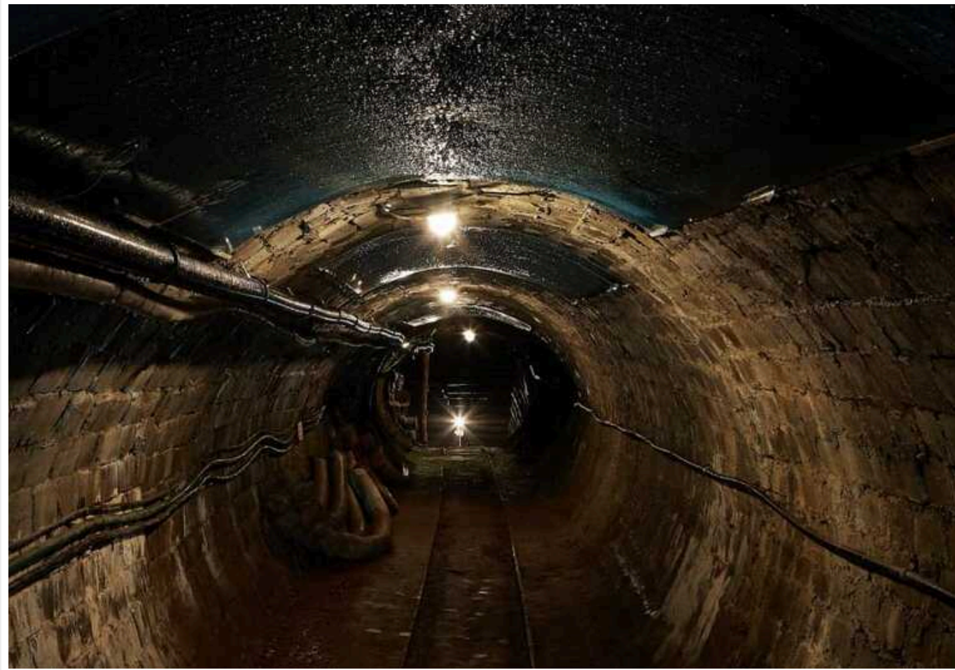
Росіяни привласноватимуть шахти на тимчасово окупованій Луганщині

До січня 2028 року права на володіння або користування майновими комплексами підприємств вугільної галузі, що перебувають у державній власності так званої "ЛНР", будуть передаватися росіянам без проведення торгів. Відповідне рішення окупанти ухвалили ще в грудні 2023 року.