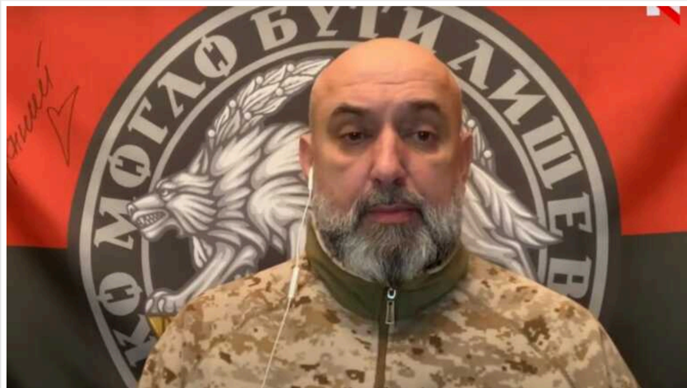
Генерал ЗСУ Сергій Кривоніс заявив про знищення окупантами виробництва ракет в Україні

Генерал-майор запасу ЗСУ Сергій Кривоніс заявив, що 29 грудня російські окупанти розбомбили виробництво ракет в Україні. Він вважає, що атаку на підприємство навів хтось ізсередини.