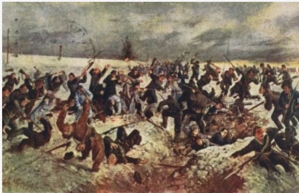
А. Кулишов: Бій під Крутами 1918

Завдяки стратегічній позиції та стійкості українських воїнів вдалося завдати значних втрат російським силам та тимчасово зупинити їхній наступ аж до настання ночі. Під значним тиском, українцям все ж довелося відступити. Вони підірвали залізничні шляхи та мости під час організованого відступу, чим ще більше затримати ворога. Пізніше, виявилось, що частина Студентської чоти – 27 чоловік, через темряву ночі заблукали та випадково вийшли на станцію Крути, яка вже була захоплена "червоними". Несподівано опинившись в полоні, хлопці зазнали катувань та були жорстоко вбиті.