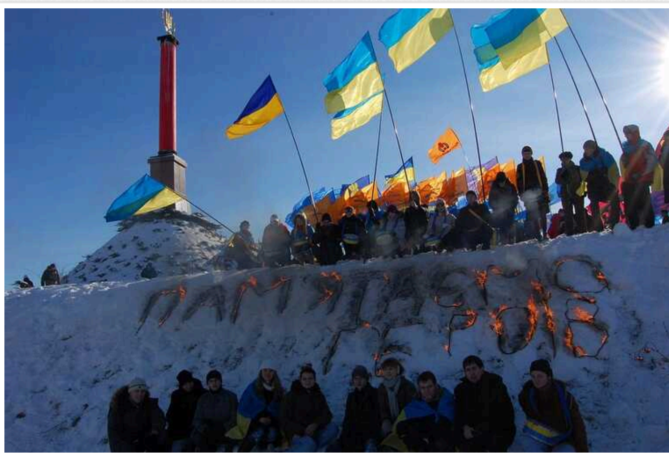
День пам'яті Героїв Крут 2024: Україна вшановує 106-ту річницю бою під Крутами

Сьогодні, 29 січня 2024 року, українці відзначають 106-річницю героїчного бою під Крутами, який є важливим символом патріотизму, віри та самопожертви.