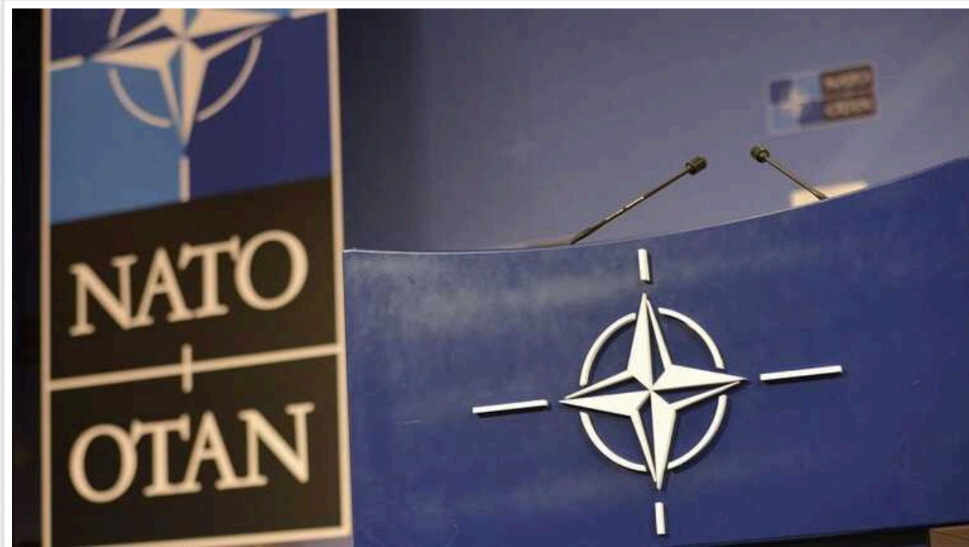
The Times: НАТО має підготуватись до ракетних атак РФ по об'єктах по всій Європі

Хоча зараз РФ зосереджена на війні в Україні, країни Заходу вже стурбовані тим, що країна-агресорка може зазіхнути й на безпеку інших країн Європи.