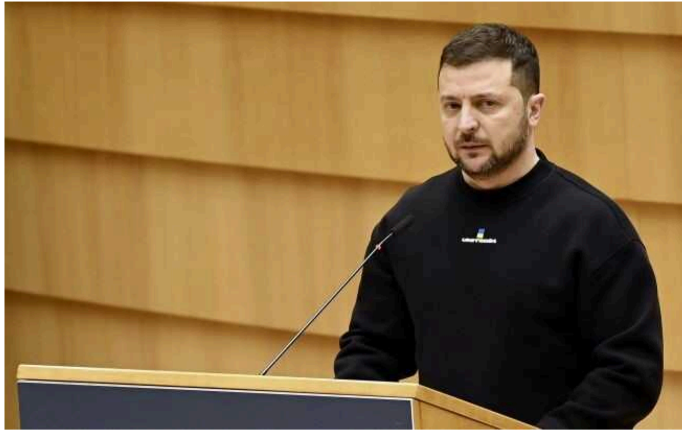
Зеленський: Ми у дуже складному моменті, але Росію можна зупинити

Президент Володимир Зеленський ухилився від прямої відповіді на запитання, чи може війна в Україні закінчитися в 2024 році, але він переконаний, що Росію можна зупинити, не допустивши знищення України й Третьої світової війни.