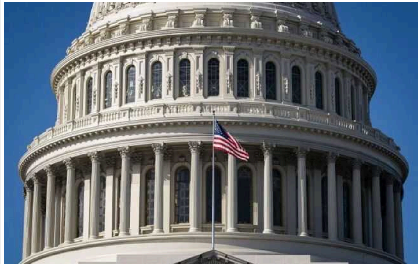
CNN: У Сенаті США сподіваються, що республіканці днями підтримають договір про кордон

Республіканці у Сенаті найближчим часом можуть підтримати угоду про кордон, незважаючи на тиск з боку колишнього президента Дональда Трампа.