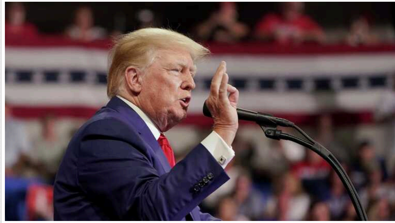
Трамп прокоментував атаку БПЛА на військову базу США в Йорданії: "Наслідки слабкості Байдена"

Кандидат у президенти США Дональд Трамп прокоментував атаку дронів на військову базу Сполучених Штатів у Йорданії, внаслідок якої загинули троє американських військовослужбовців та десятки було поранено. Напад экс-президент США пов'язує із наслідками політики чинного голови Білого дому Джо Байдена.