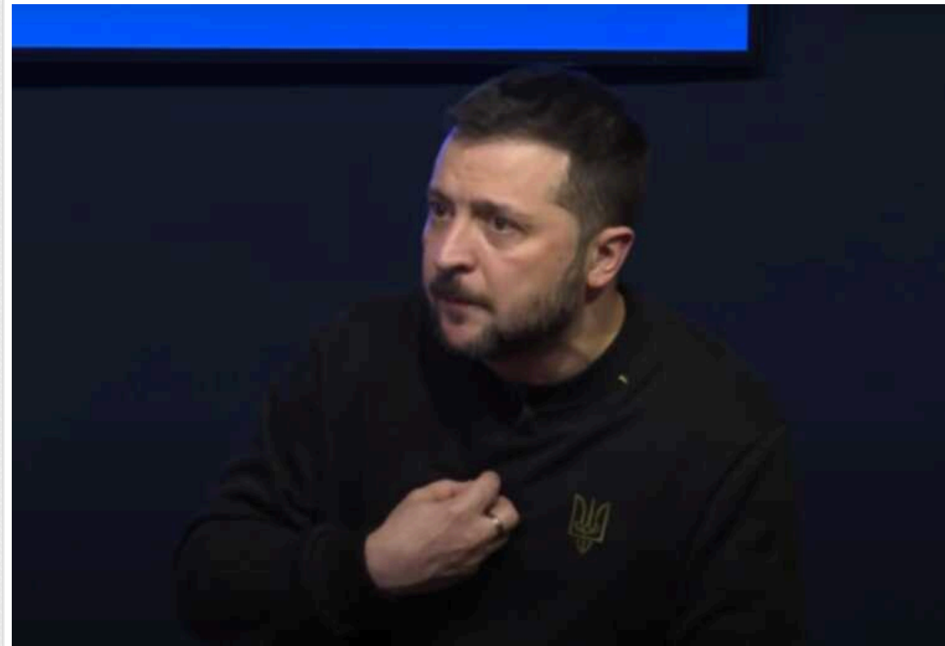
Росіяни запустили новий фейк: ЗСУ готують держпереворот через критику Зеленського

Росіяни брешуть про черговий «заколот» в Україні.