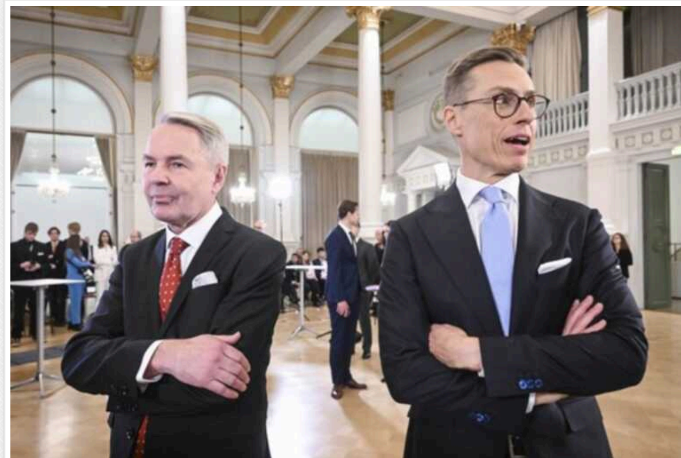
Вибори президента у Фінляндії: стало відомо, хто вийшов у другий тур

Найбільше голосів набрали колишній глава МЗС Пекка Гаавісто (ліворуч) та колишній прем'єр Александер Стубб (праворуч).