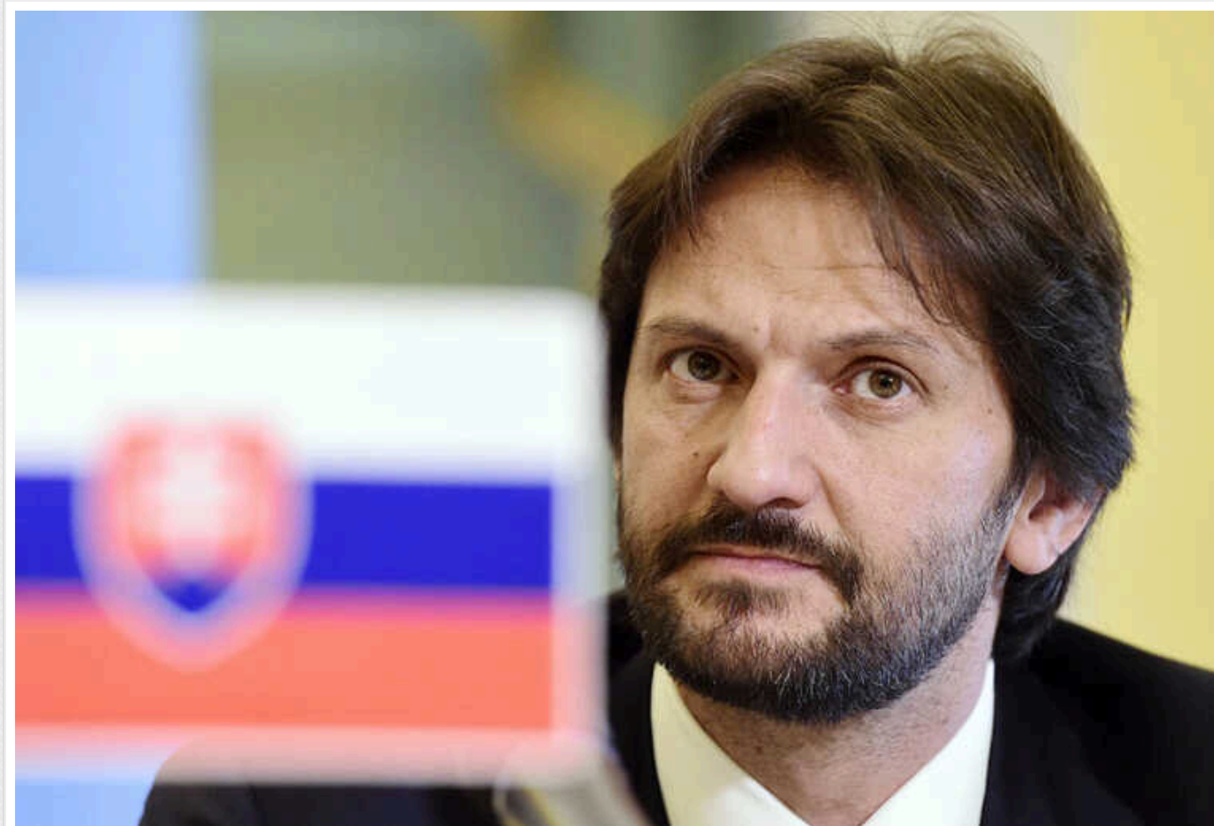
У Міноборони Словаччини закликали до переговорів щодо завершення війни в Україні

Війна в Україні не має військового рішення. Пора почати говорити про мирні переговори.