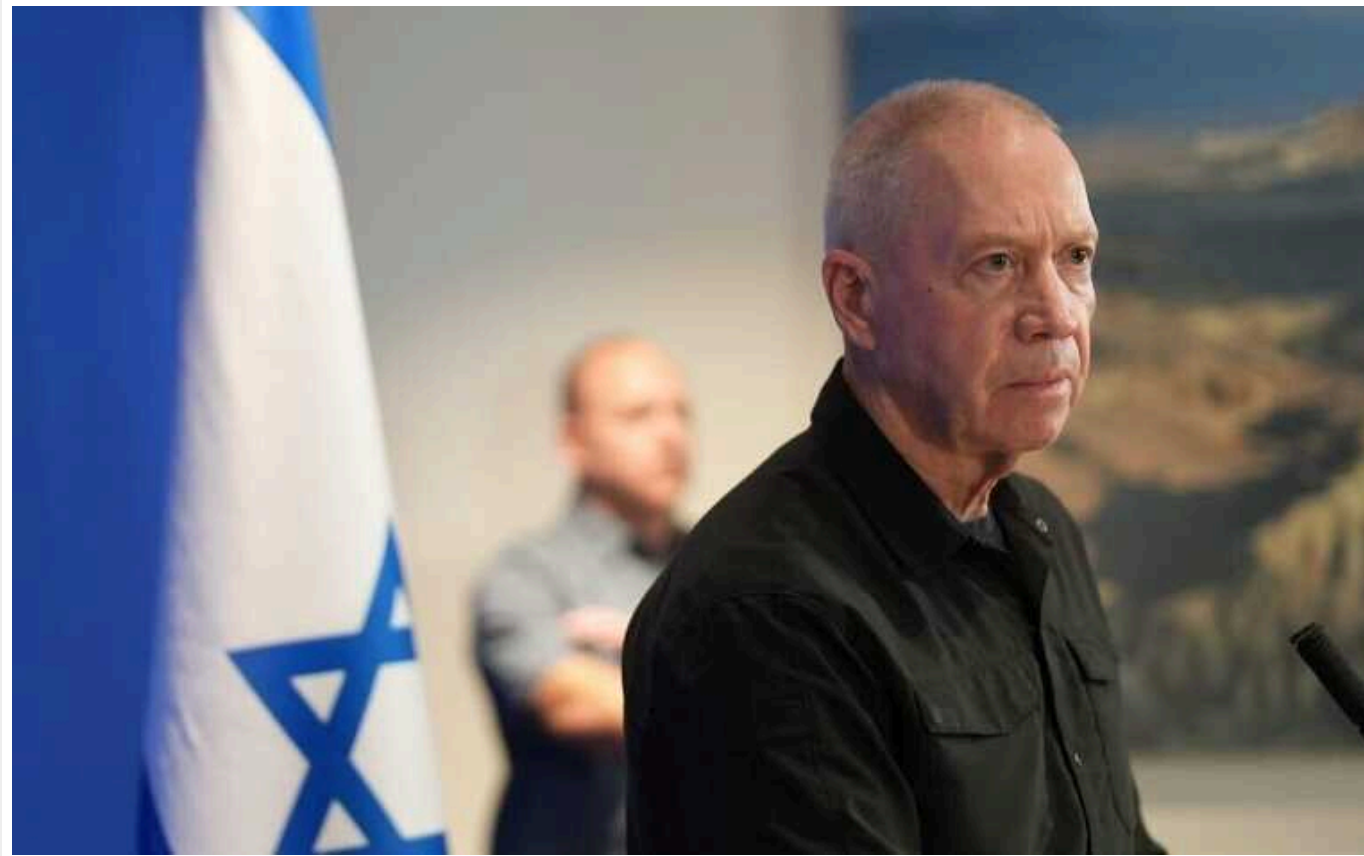
У бойовиків ХАМАС є два варіанти: здатися або бути вбитим, - Галант

Поки лідери ХАМАСу в Катарі насолоджуються життям, сповненим розкоші, командири терористичного угруповання на місцях у Газі гинуть і здаються в полон тисячами.