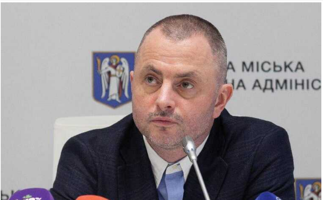
Експерт мер Києва Кличка розповів про розкрадання столичною владою мільярдів гривень