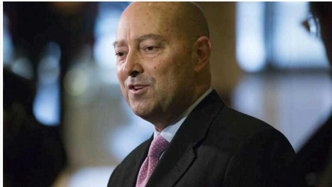
Експлаком НАТО спрогнозував переговори РФ та України до кінця 2024 року

Росія та Україна виснажені війною, що затягнулася, що може створити вікно для діалогу, заявив колишній верховний головнокомандувач силами НАТО в Європі Джеймс Ставрідіс.