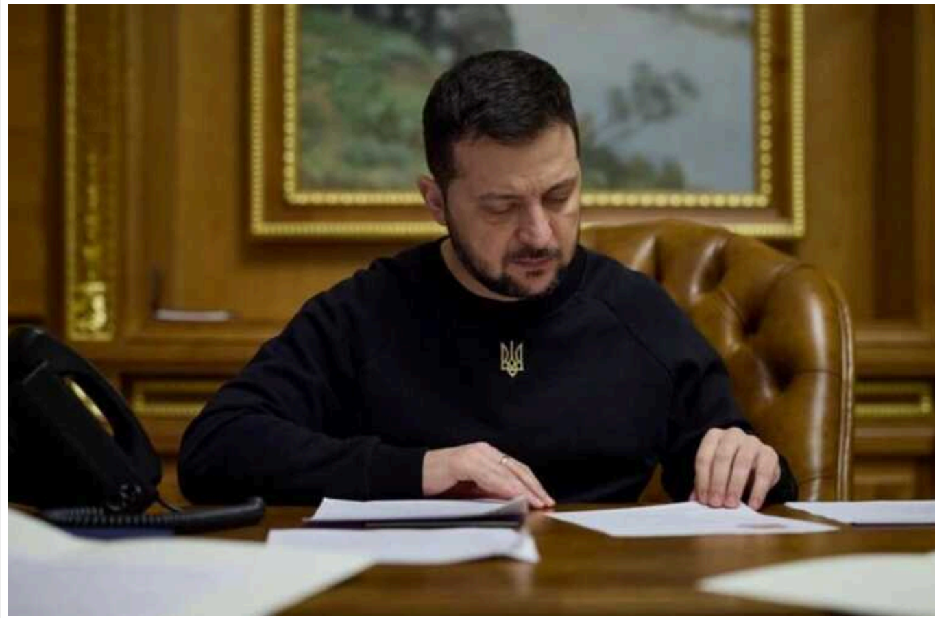
Президент Зеленський оприлюднив декларації про доходи та витрати за два роки

Згідно з оприлюднених декларацій, доходи президента Володимира Зеленського та його родини зменшилися з 10,8 мільйонів гривень у 2021 році до 3,7 мільйонів у 2022 році.