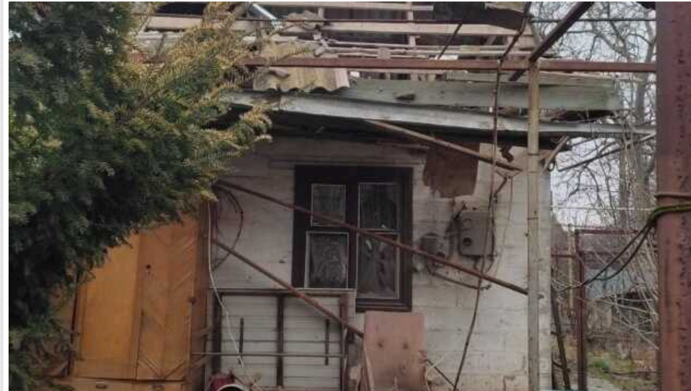
Окупанти сім разів атакували Нікопольщину дронами-камікадзе, є руйнування

Російські ударні дрони впродовж дня сім разів атакували Нікопольський район Дніпропетровської області.