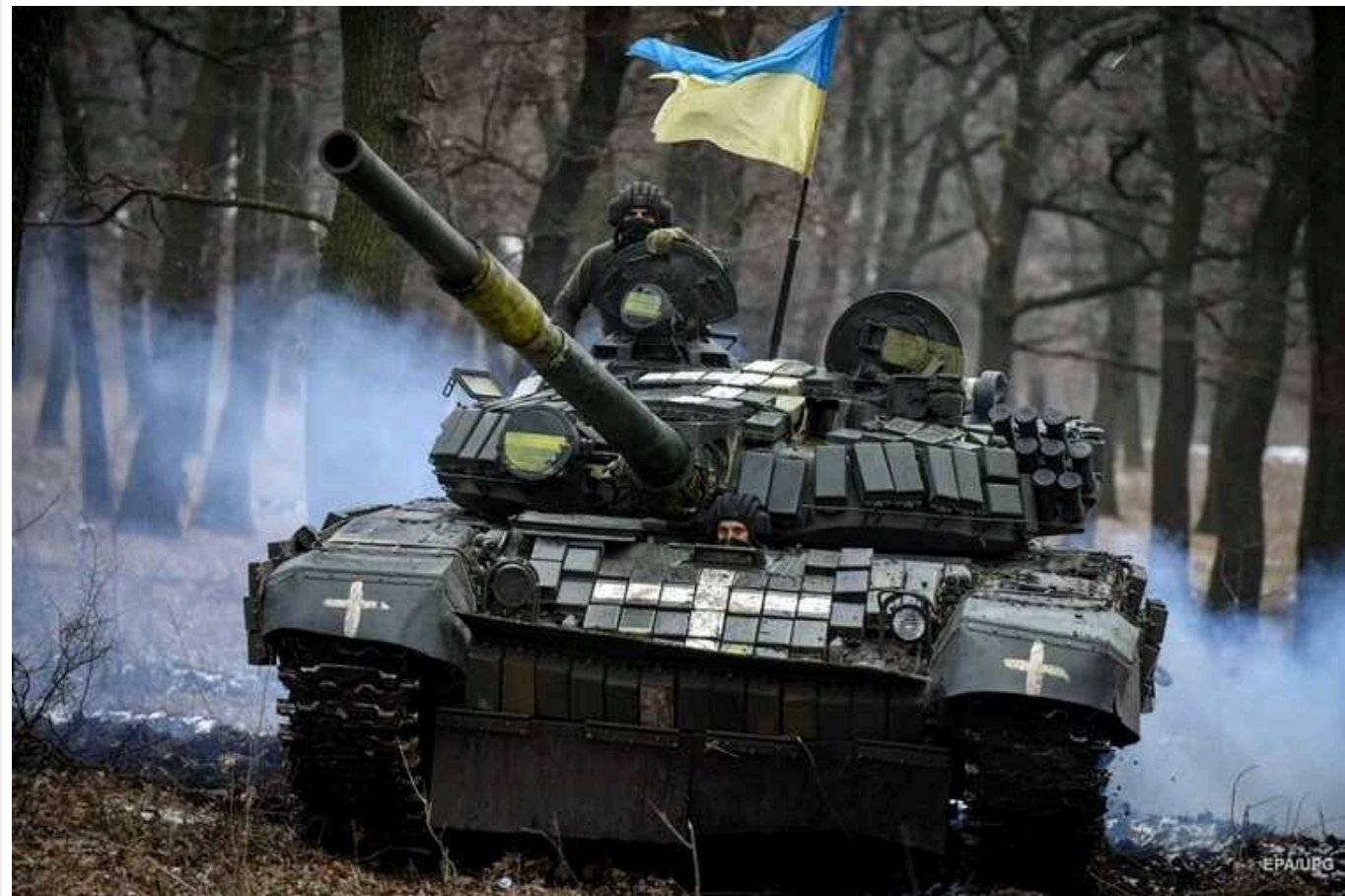
Ситуація на фронті: протягом доби відбулось 61 бойове зіткнення

У неділю на Авдіївському напрямку Сили оборони відбили 21 ворожу атаку, на Мар'їнському – 18.