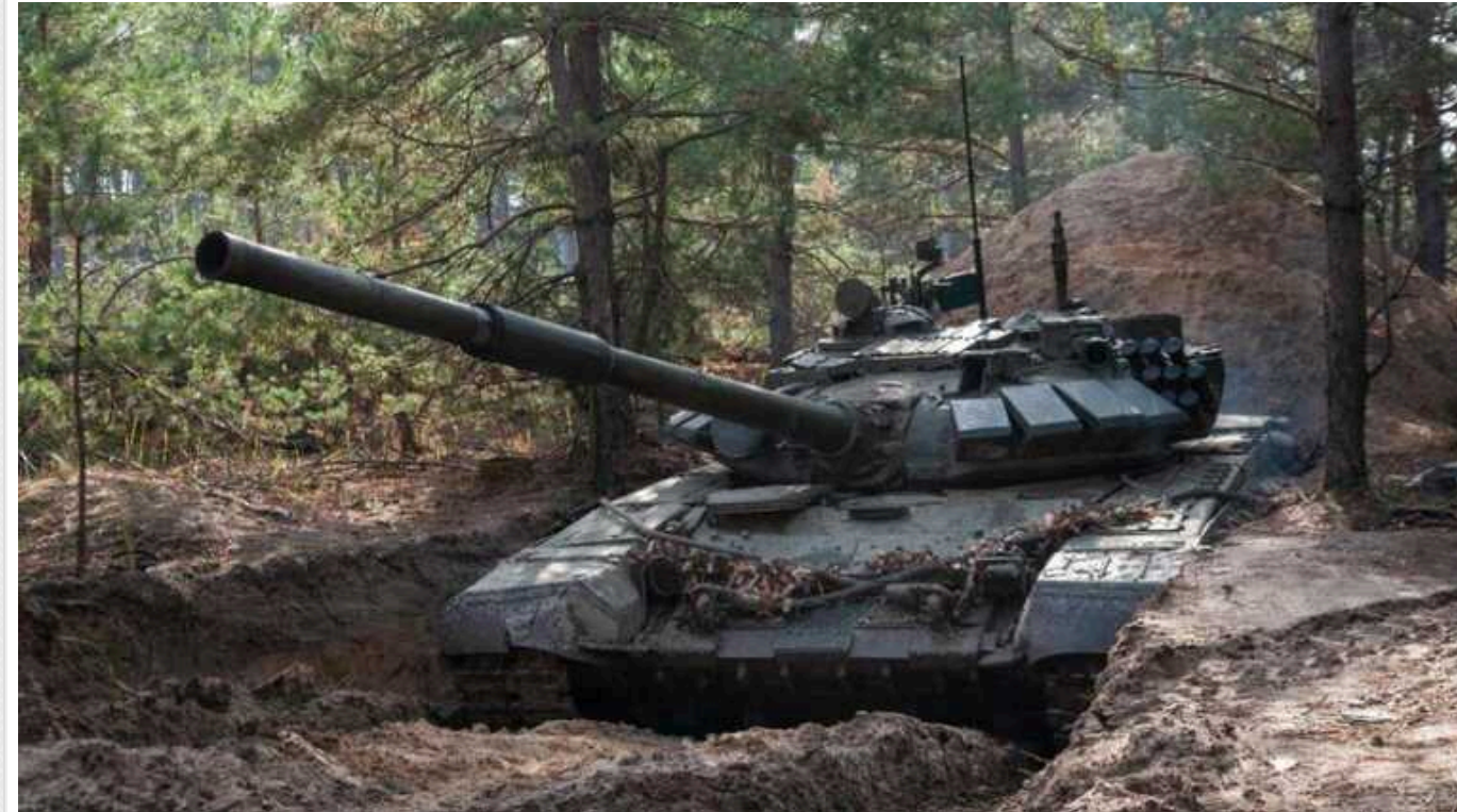
У ЗСУ розповіли про "досягнення" окупаційних військ на сході України

Російські війська на сході України не мають стратегічних успіхів, хоча окупанти й намагаються наступати.