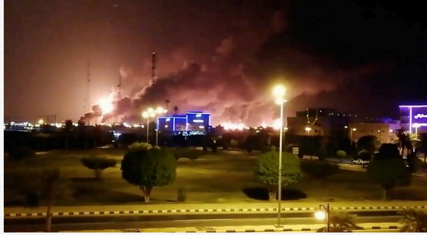
Пожежа на НПЗ Saudi Aramco

Наприклад, заводи компанії Saudi Aramco в містах Абкайк і Хурайс у 2019 році Іран атакував, коли більшість зон ППО саудитів працювали на півдні по Ємену.