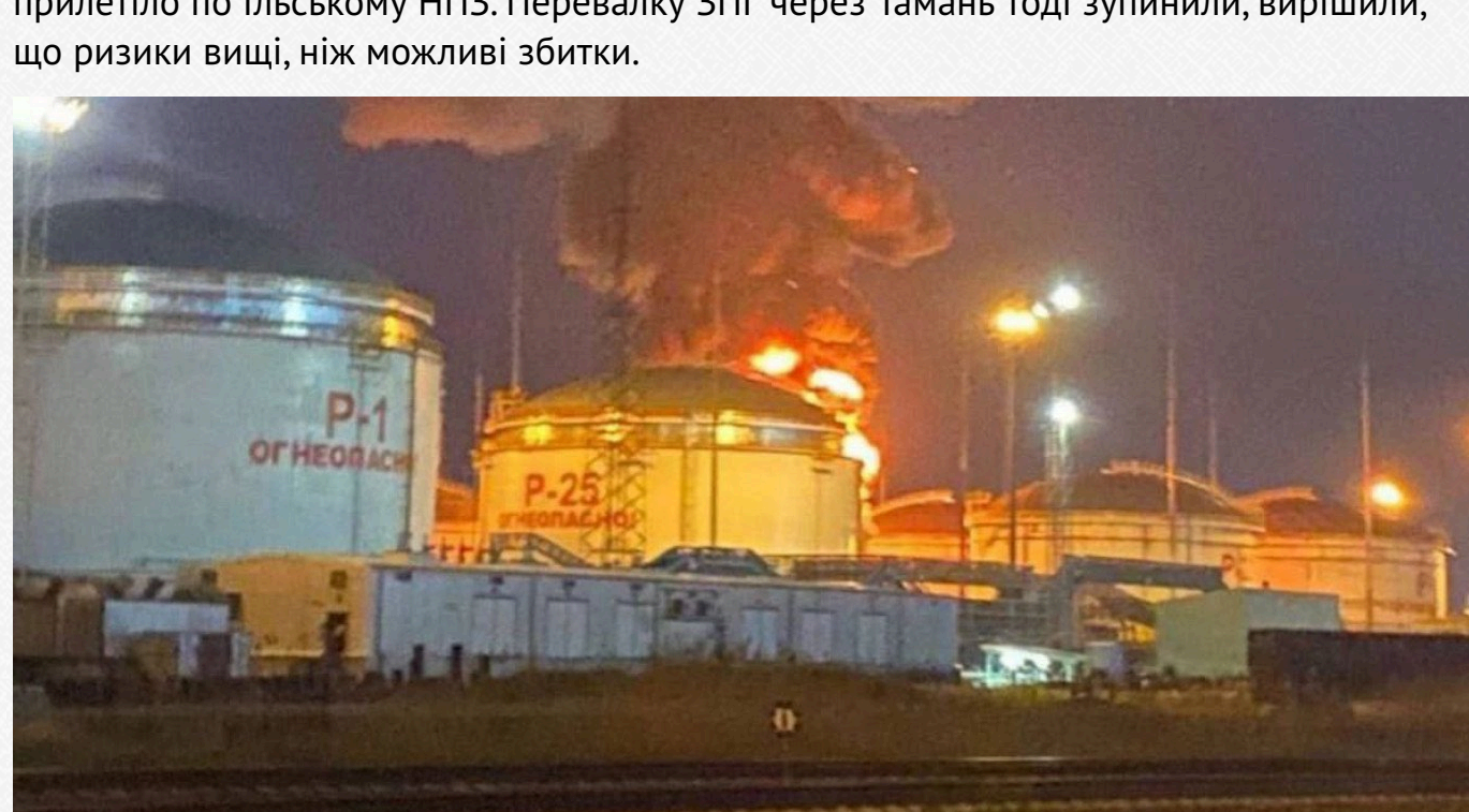
Пожежа на газовому терміналі в Тамані

Перша ластівка була ще під час ураження газового терміналу в селищі Волна біля порту Тамань 3 травня 2023 року. Тоді пожежа тривала добу, а вже 5 травня прилетіло по льському НПЗ. Перевалку ЗПГ через Тамань тоді зупинили, вирішили, що ризики вищі, ніж можливі збитки.