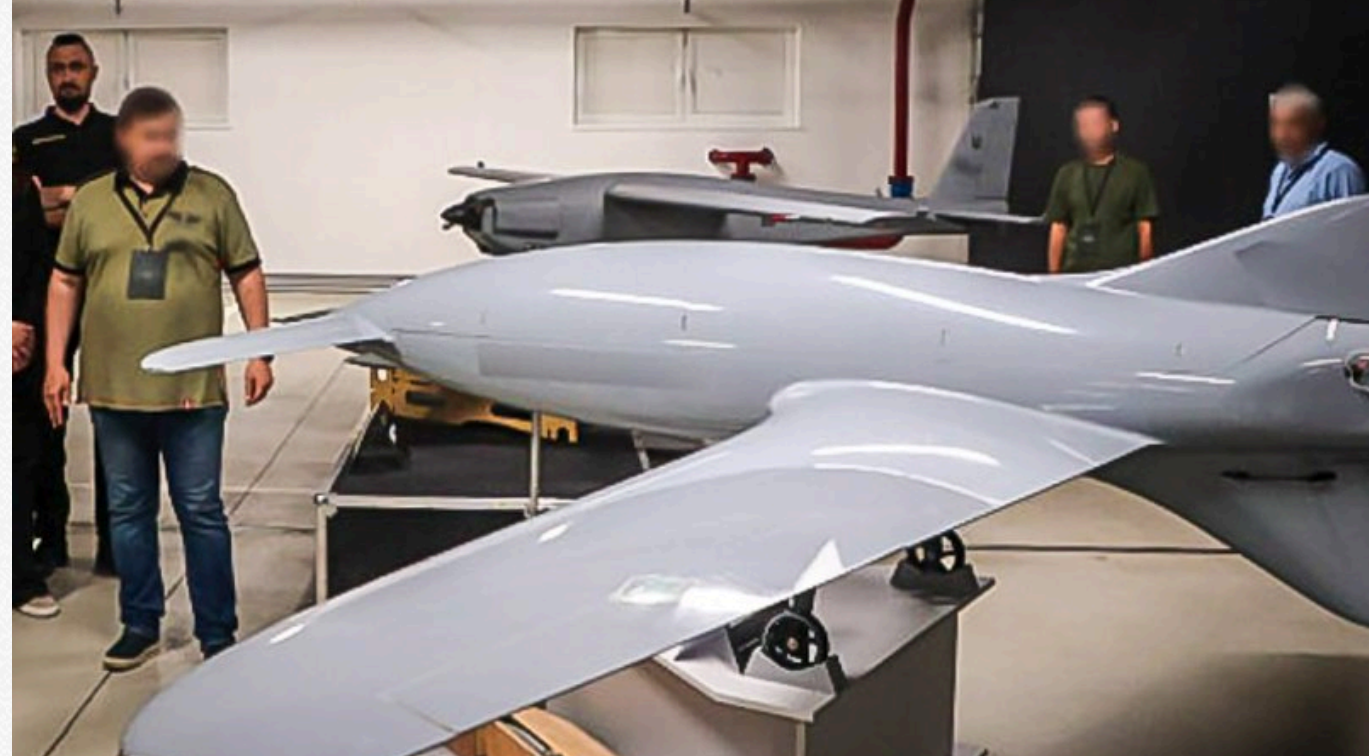
Ударний дрон українського виробництва «Бобер» (Beaver)

І те, що Москва пристосувала його для атак на трансформатори чи перевалку зерна, не робить наш об'єкт ідеальною ціллю для Shahed — Україна не держава переробки вуглеводів, для котрої прильоти 50-кілограмових боеприпасів означає зупинку технологієв важливої галузі, довге гасіння пожежі і сплату пені за зірвані контракти.