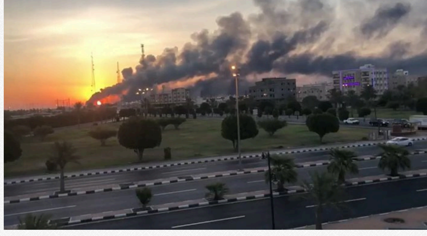
Пожежа на НПЗ Saudi Aramco

Ювелірна точність не така важлива, адже вежа перегонки — це 50–60-метрова споруда з реактором, точками аерації та насосами. Кудись-то влучить — і обов'язково щось виведе з ладу, зазначає видання LB.ua .