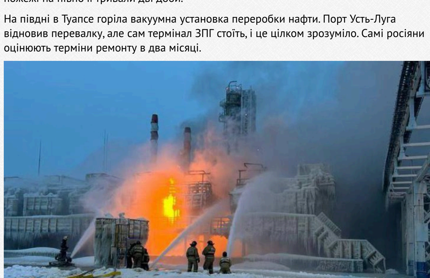
Пожежа на нафтовому терміналі в Усть-Лузі

На півдні в Туапсе горіла вакуумна установка переробки нафти. Порт Усть-Луга відновив перевалку, але сам термінал ЗПГ стоїть, і це цілком зрозуміло. Самі росіяни оцінюють терміни ремонту в два місяці.