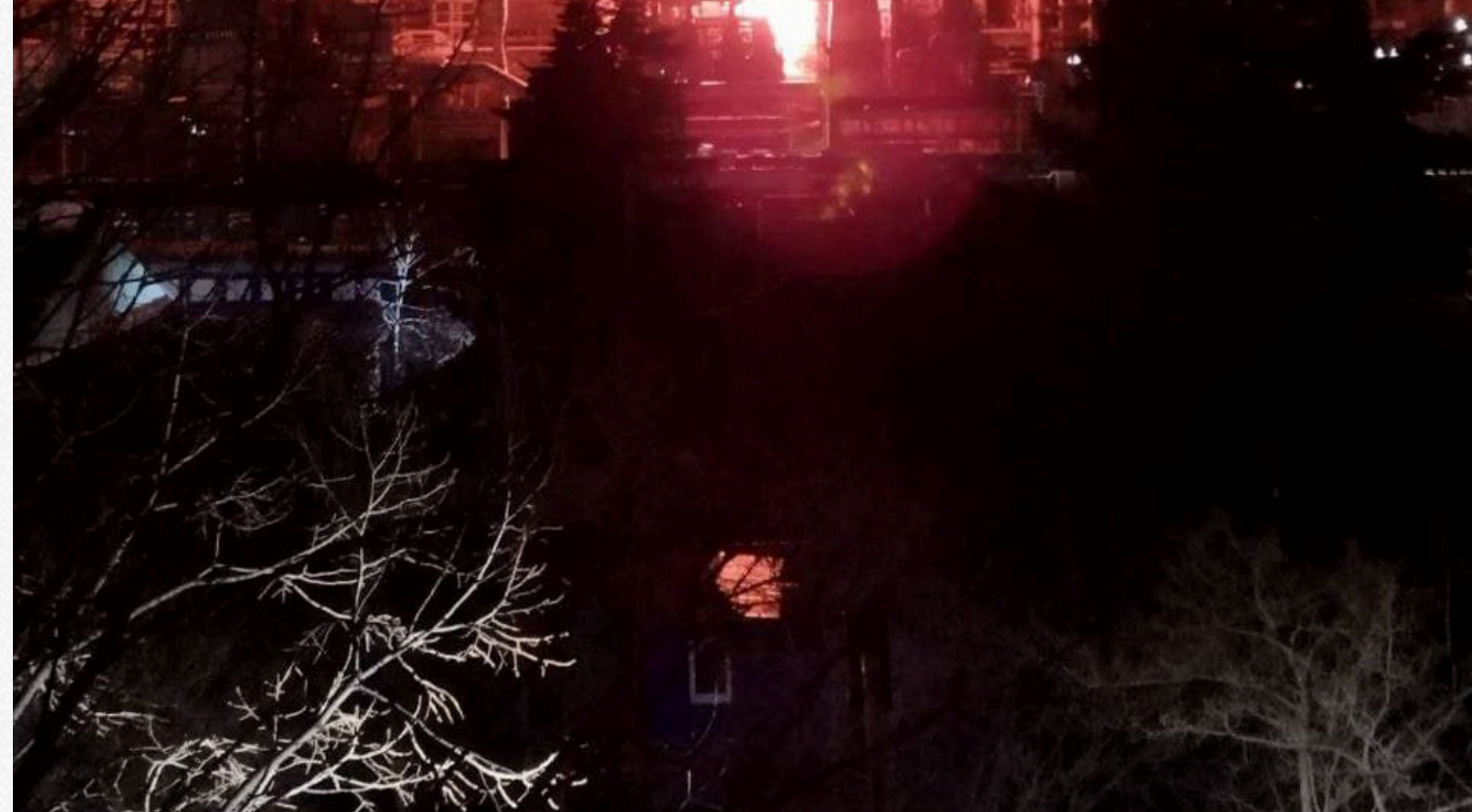
Вибух на пороховому заводі в Тамбовській області РФ

Що дозволяє нам масувати сили та засоби в точках інтересу.