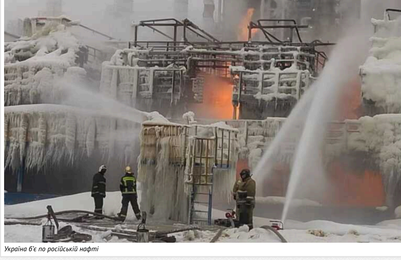
Україна б'є по російській нафті

Іран ударив по російських НПЗ і ЗПГ у тому, що Іран розробляє Shahed саме як зброю проти саудівських нафтових потужностей. Невеликий заряд, який наводять за інерційною системою та GPS, прошиває колону крекінгу, танкер під завантаженням або установку зі зрідження газового конденсату.