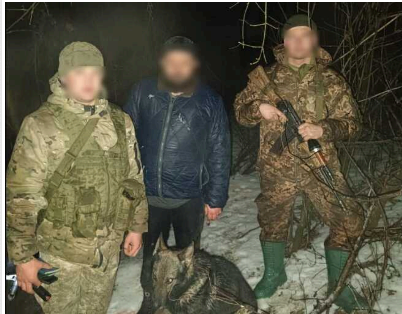
Прикордонники врятували "дайвера", що намагався добратися вплав до Угорщини

На Закарпатті прикордонники Мукачівського загону витягли з річки Тиса 28-річного жителя Рівненщини, який незаконно намагався потрапити до Угорщини. Чоловік потребував допомоги, бо не мав сил самостійно вибратися з води.