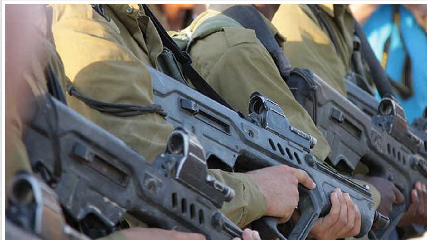
У Білому домі можуть знизити постачання зброї Ізраїлю, щоб переконати уряд Нетаньягу припинити наступ у Секторі Гази

Про це повідомляє канал NBC News із посиланням на американських чиновників.