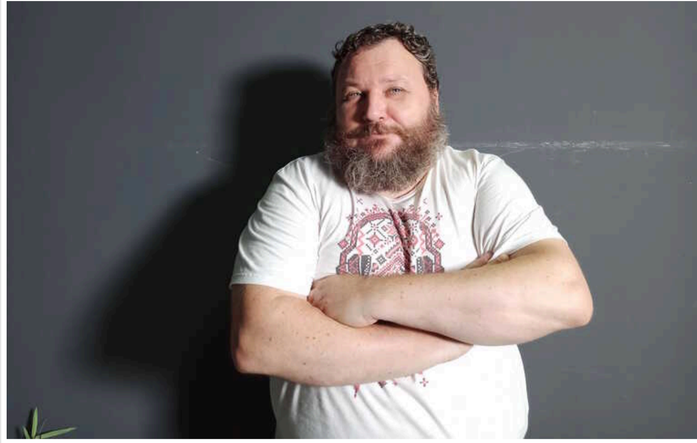
Рядову людину треба поставити перед реалістичним вибором: "Або служиш, або сидиш у в'язниці", - Дикий

Рядову людину треба поставити перед реалістичним вибором: або ти три роки служиш, або ти три роки сидиш у в'язниці.