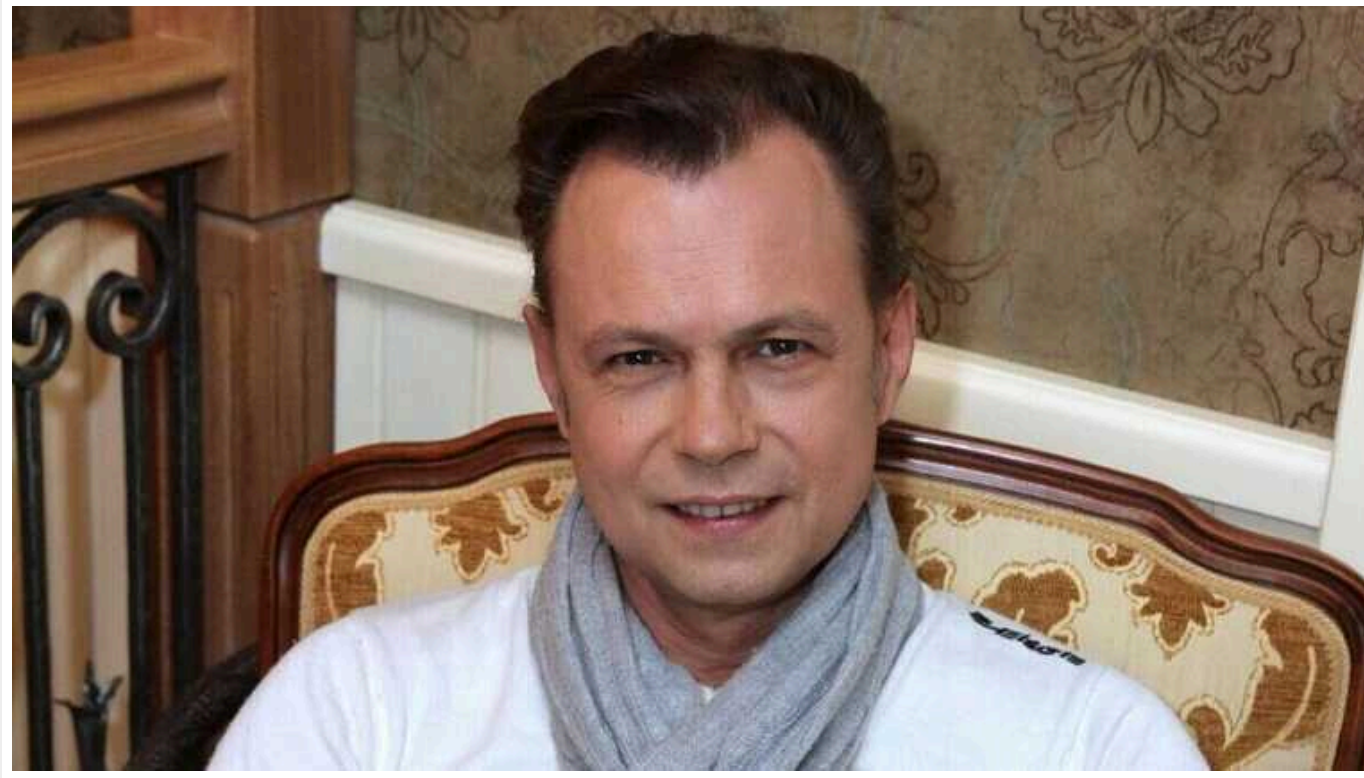
Соліст російського гурту "На-На" Льовкін заявив, що ходив до військкомату після оголошення мобілізації в РФ

Соліст колись популярного радянського та російського гурту "На-На" Володимир Льовкін яро підтримує путінський режим і війну в Україні. За словами Z-патріота, він навіть ходив до військкомату після оголошення мобілізації у країні-терористці. Щоправда, "захищати" свою палко улюблену батьківщину співак не планував.