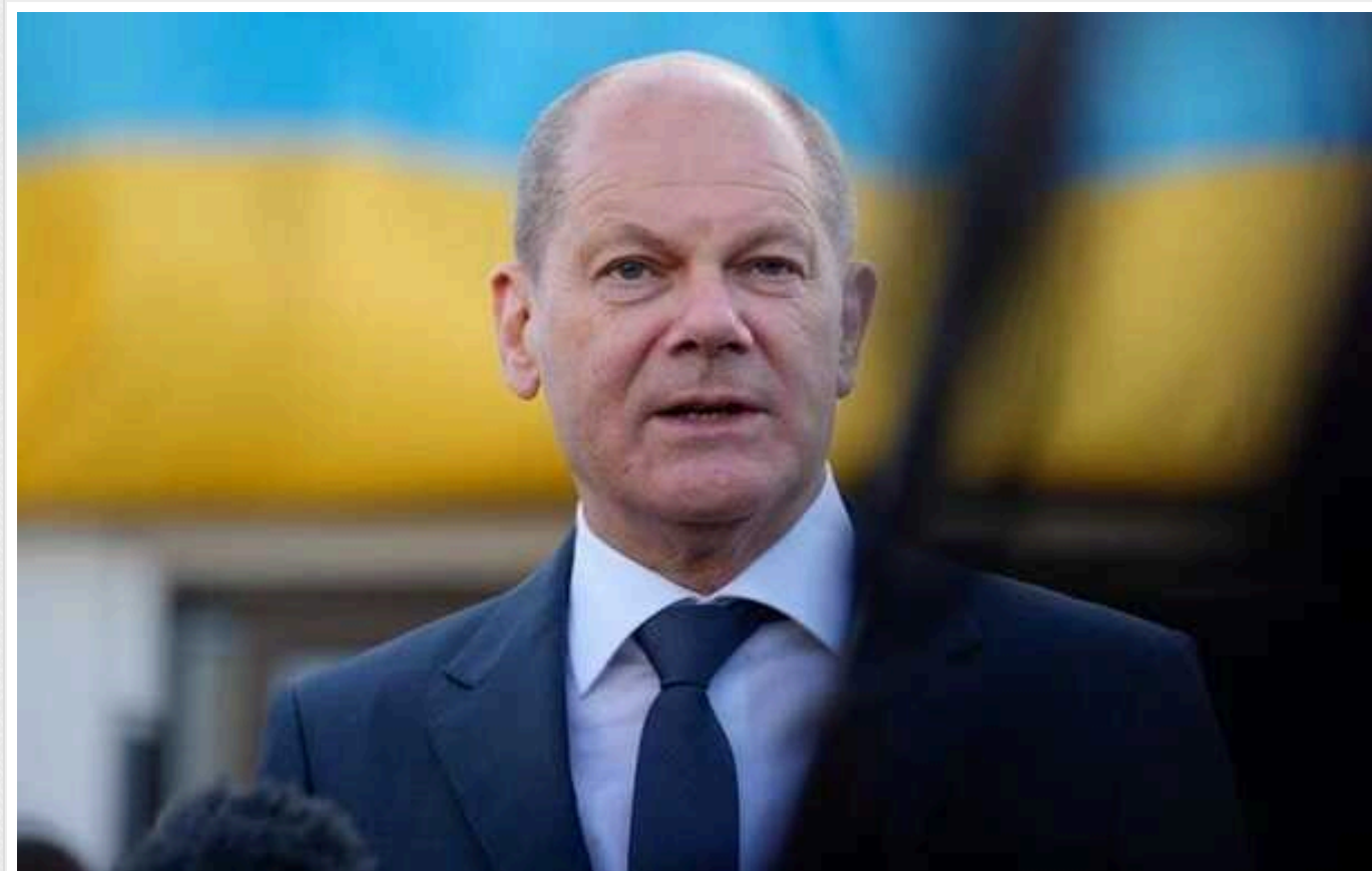
Шольц закликав країни Євросоюзу посилити допомогу Україні, щоб мир настав швидше

Німеччина у 2024 році витратить більше 7 млрд євро (7,6 млрд доларів) на допомогу Україні. Європейські союзники повинні посилити свою підтримку Києва.