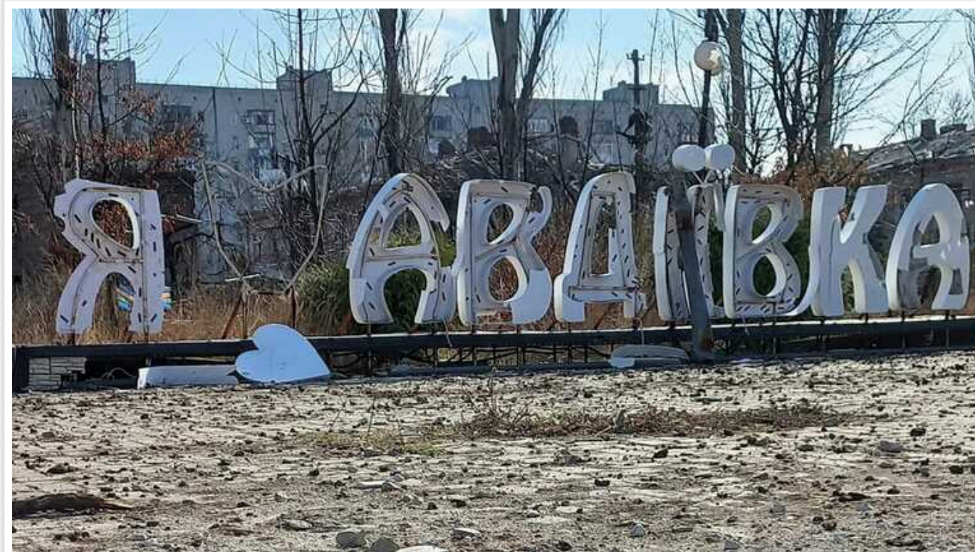
Окупанти на околицях Авдіївки: аналітики розповіли, чим це загрожує ЗСУ