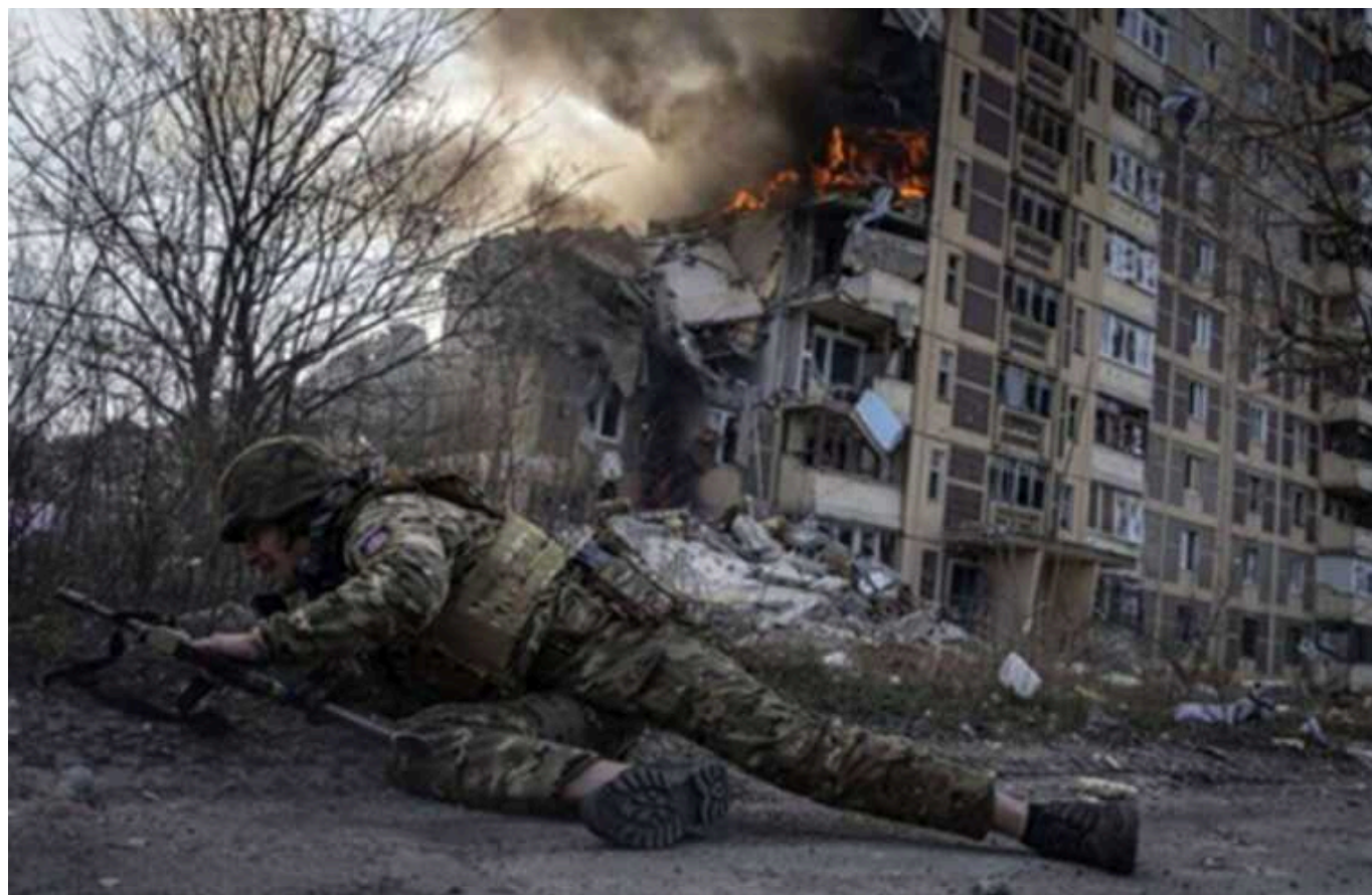
Загарбники небезпечно просунулися під Авдіївкою: розумним рішенням буде виведення українського гарнізону, – військовий

Також екскомандир роти "Аїдару" розповів про співвідношення сил і втрат на цій ділянці фронту.