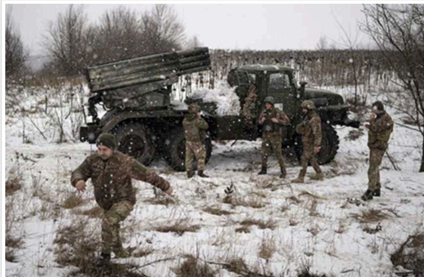
Польський політик зробив оптимістичний прогноз щодо війни: Україна зможе вистояти ще "100 років"

Мирослав Чех переконаний, що цього року Україні будуть надані всі засоби для перемоги.