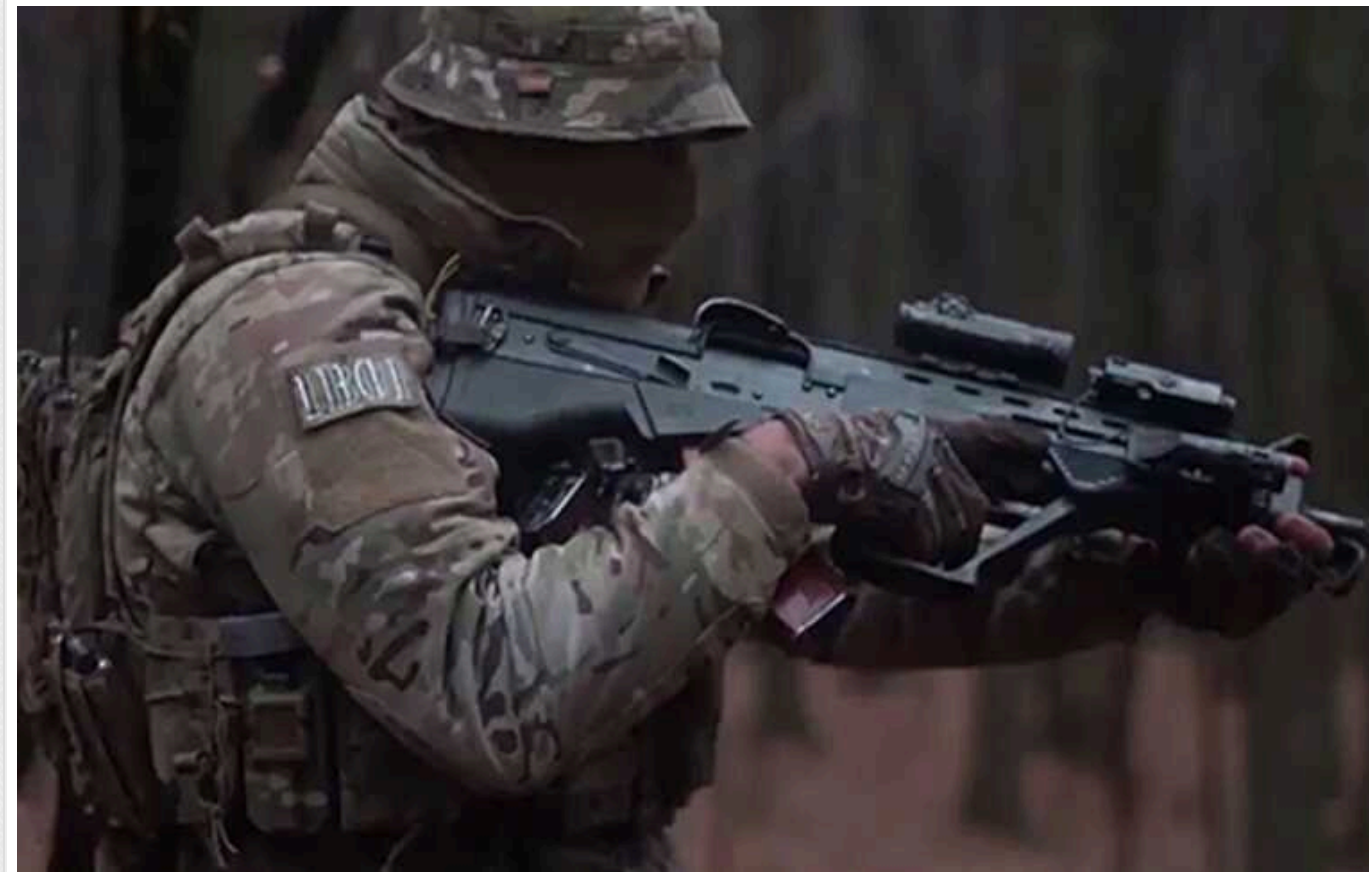
Навіть без підтримки: ССО зухвало захопили ворожу позицію та взяли полонених на Донеччині

Сили спеціальних операцій Збройних сил України знищили ворожий опорний пункт на Донецькому напрямку. Воїни ССО не лише зачистили опорний пункт, а й взяли у полон двох російських військовослужбовців.