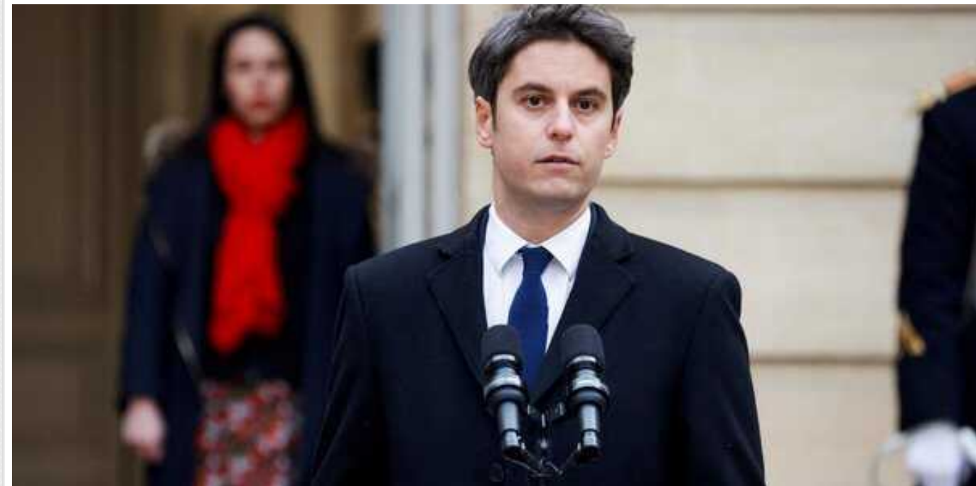
Французький прем'єр пообіцяв фермерам додаткові заходи щодо їхнього захисту від нечесної конкуренції

Прем'єр-міністр Франції Габрієль Атталь заявив у неділю, 28 січня, що він розглядає "додаткові" заходи на національному та європейському рівнях для захисту фермерів від недобросовісної конкуренції з боку інших країн, які не підпадають під ті ж регуляторні обмеження.