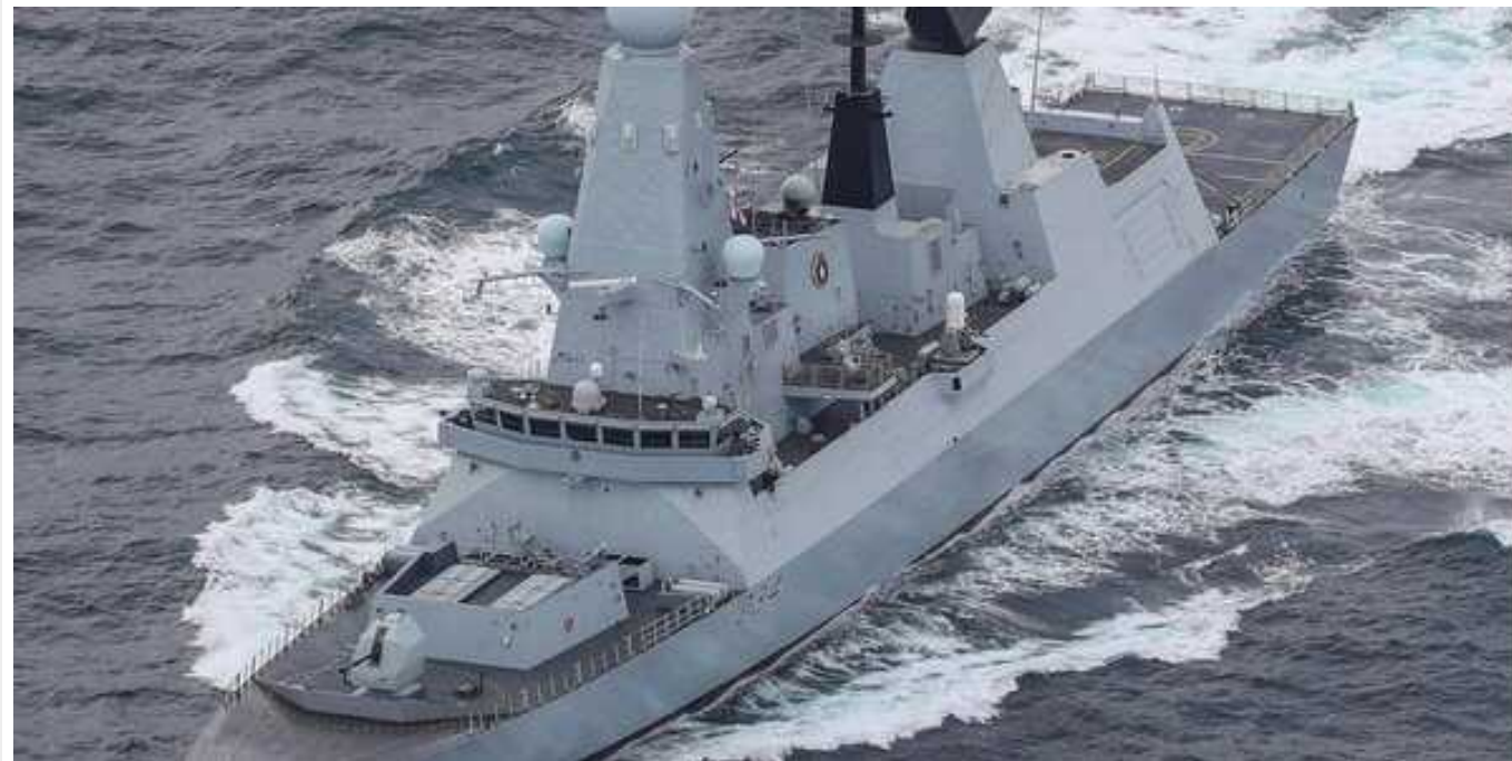
У Червоному морі британський військовий корабель зазнав атаки хуситів

У Червоному морі безпілотник хуситів атакував британський військовий корабель.