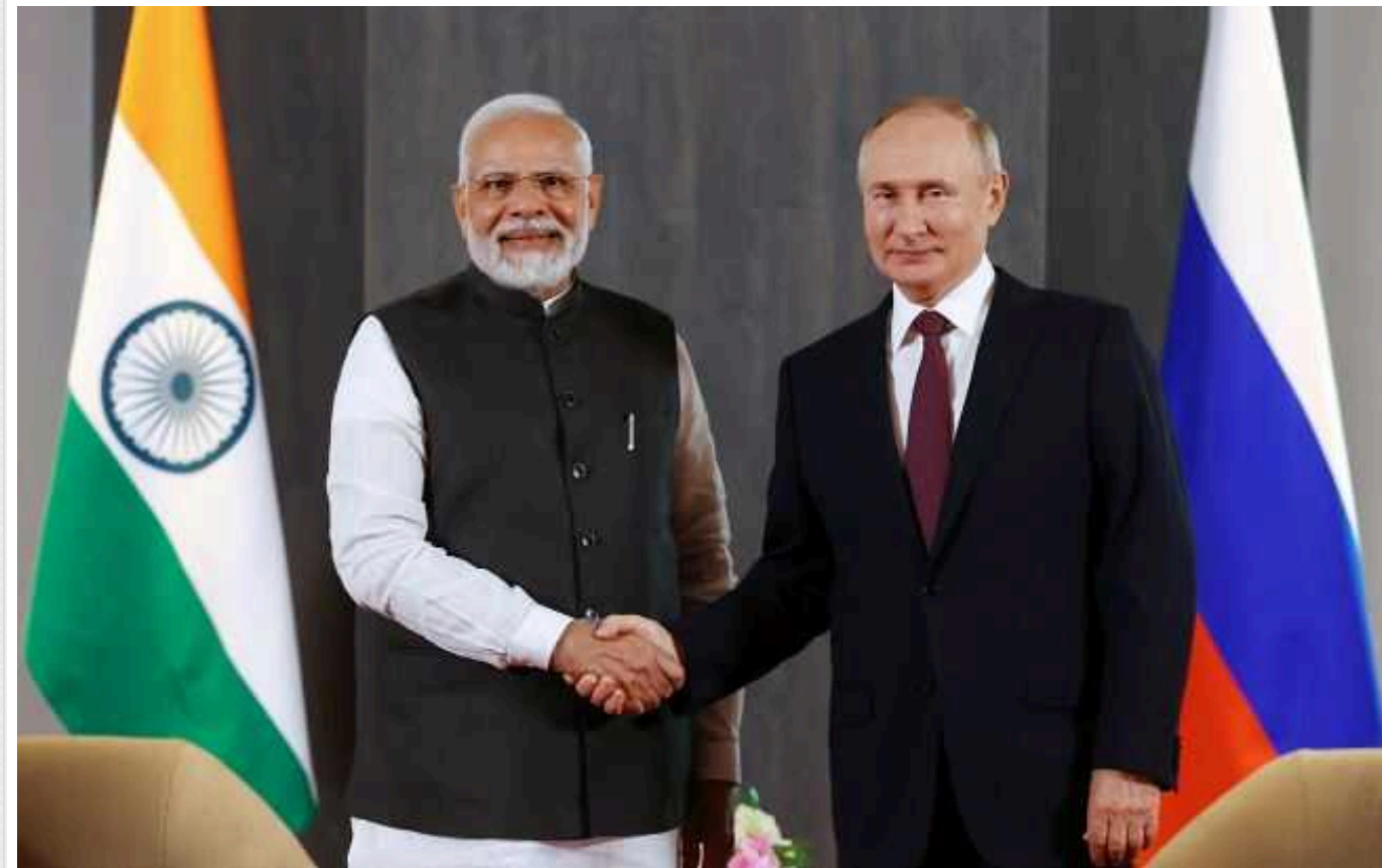
Reuters: Індія хоче відмовитися від російської зброї та дистанціюватися від Москви

Індія хоче відмовитися від російської зброї та дистанціюватися від Москви. Але Нью-Делі хвилюється, що це може підштовхнути Москву ближче до Китаю.