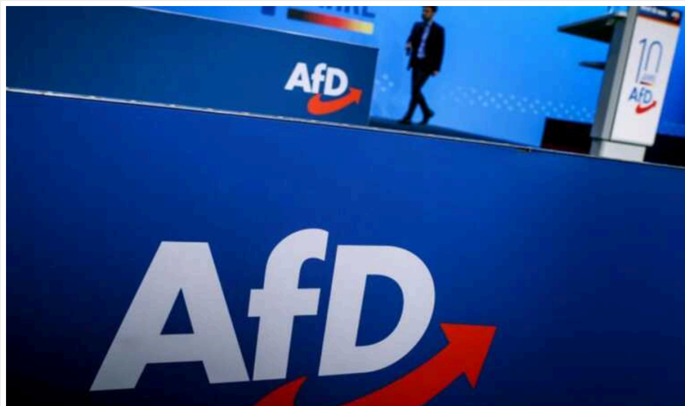
У Німеччині росте число членів ультраправої "АдН", незважаючи на протести

Масові протести проти ультраправих у Німеччині не вплинули на кількість охочих приєднатися до правопопулістської "Альтернативи для Німеччини" (АдН).