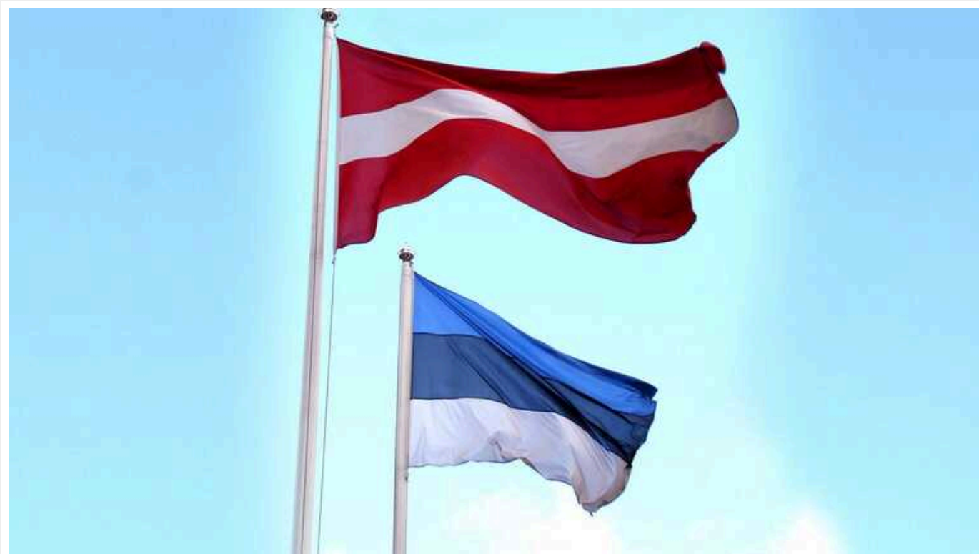
Латвія сподівається на співпрацю з Естонією у будівництві АЕС