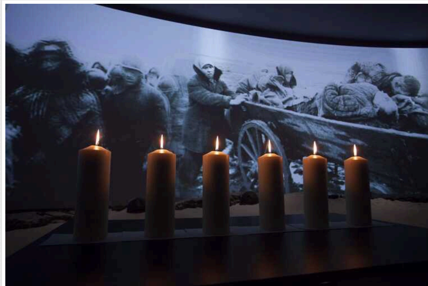
У Польщі обурилися через відеоролик Єврокомісії до Дня пам'яті жертв Голокосту: не згадали окупацію країн

Польщу обурило відео з профілю президентки Єврокомісії Урсули фон дер Ляен до Міжнародного дня пам'яті жертв Голокосту.