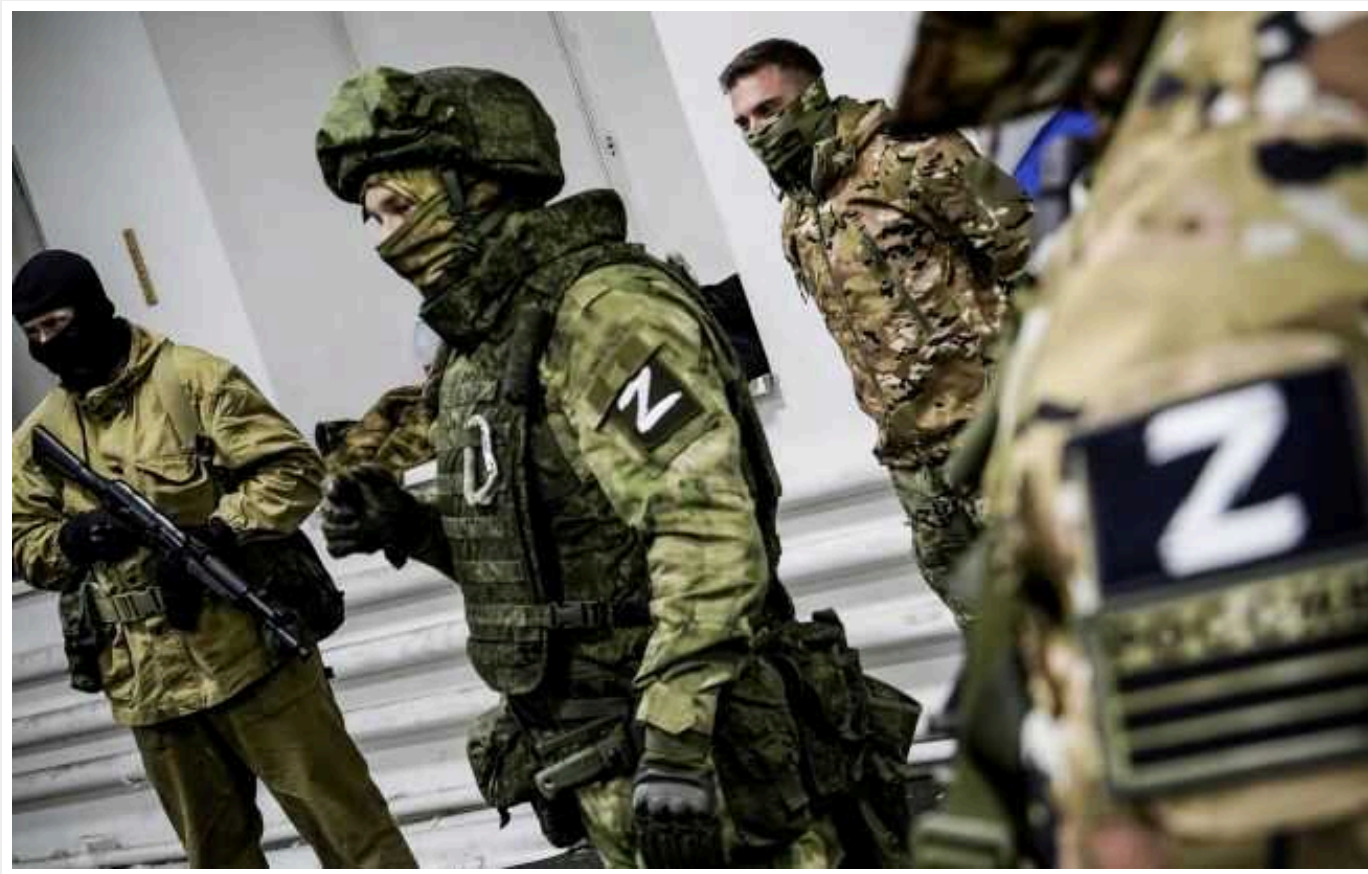
РФ посилює вербування іноземних студентів, - ЦНС

Останнім часом до полону наших воїнів все частіше потрапляють іноземці, які були завербовані російськими терористами до свого війська.