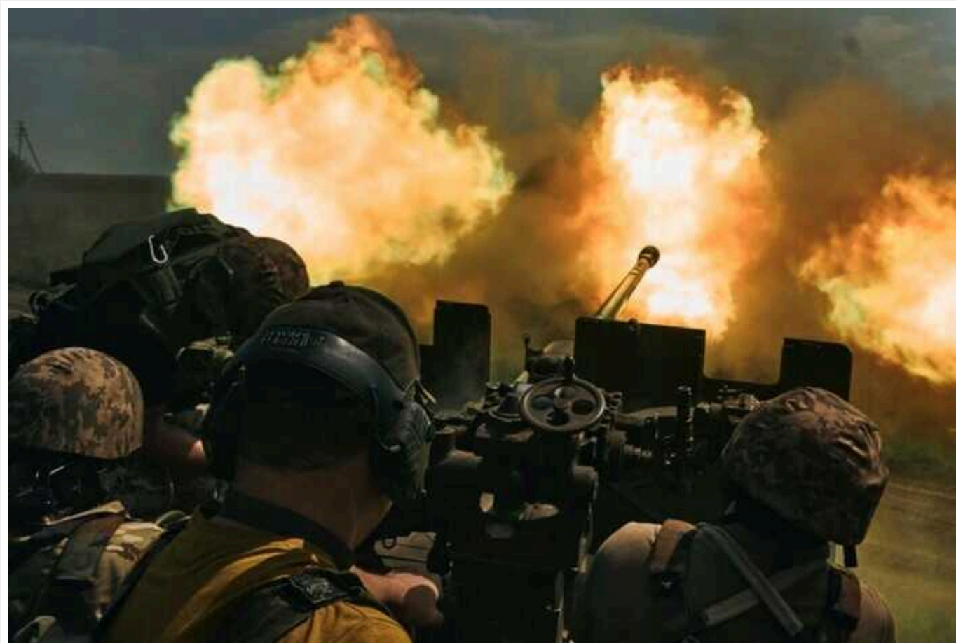
Ворог навідає: "росіяни дуже активні, збільшили кількість наступальних операцій, другий день ведуть по 50 боєзіткнень", - CNN

Видання пише про бойові дії зі слів українських військових чиновників без прикрас: