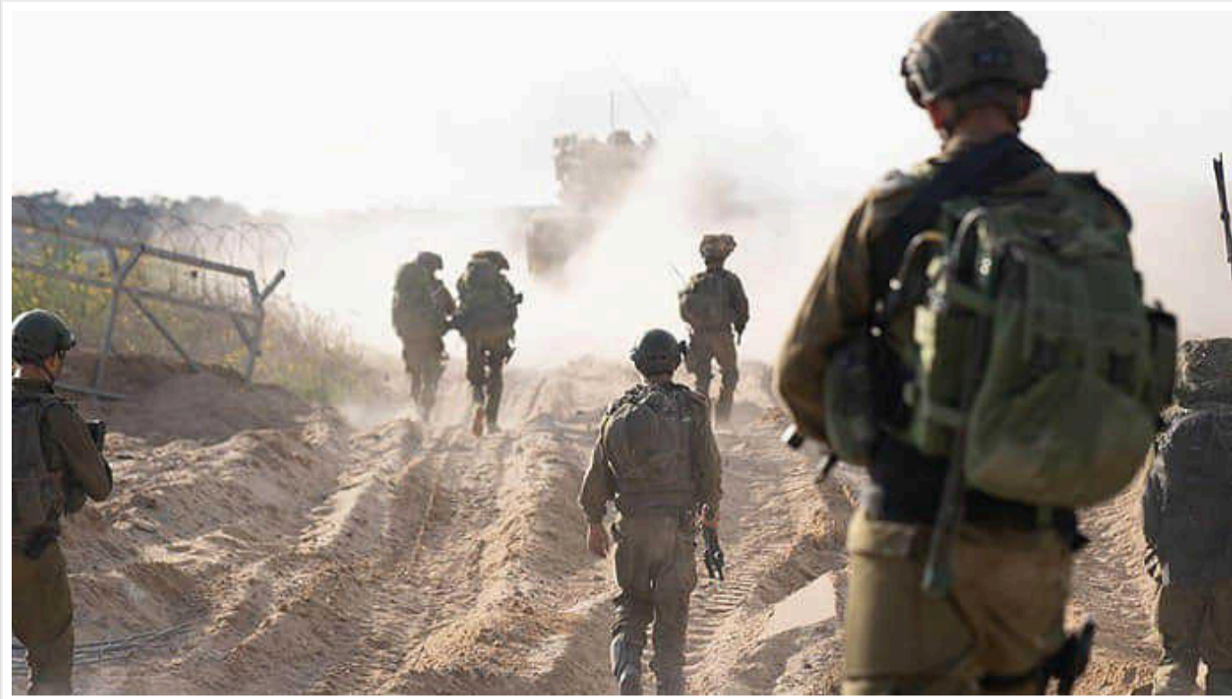
New York Times: У найближчі два тижні між ХАМАС та Ізраїлем може бути укладена угода про повне припинення вогню як мінімум на два місяці в обмін на звільнення заручників