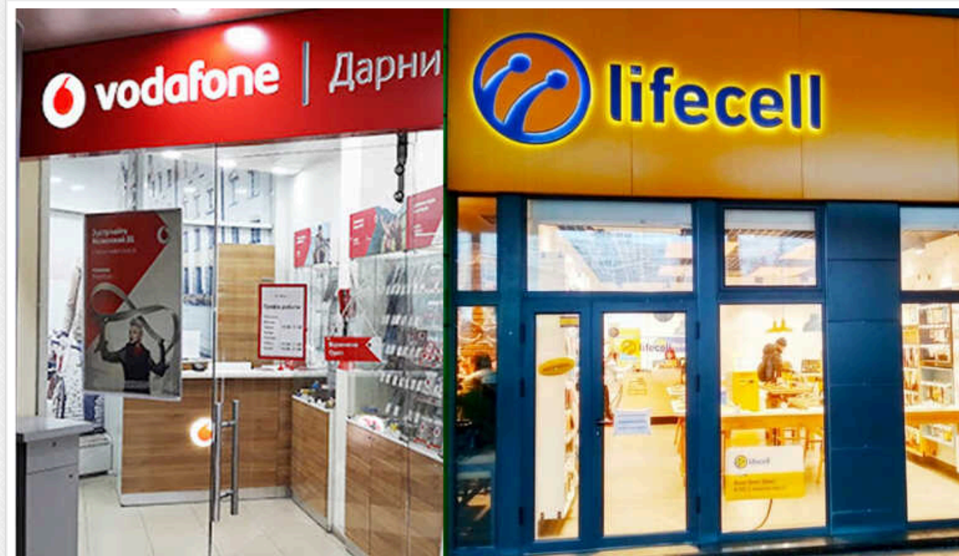
Lifecell подав до суду на Vodafone: що не поділили між собою мобільні оператори

Вже незабаром представники компаній Lifecell та "Vodafone Україна" зустрінуться у суді. Причиною стала популярна послуга, яку не поділили оператори.