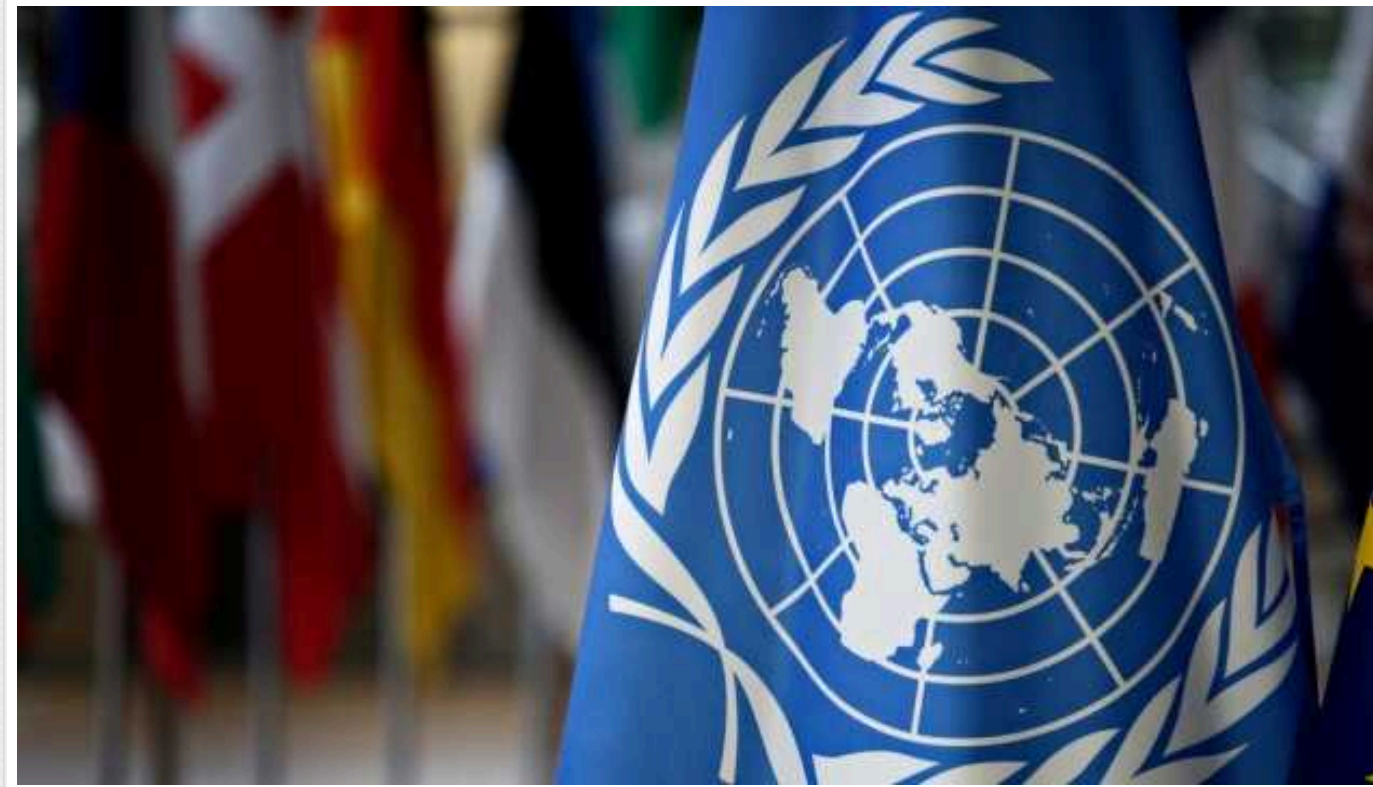
ЗМІ: Дев'ять країн призупинили фінансування Агентства ООН у справах палестинських біженців

На цей час уже дев'ять країн-донорів призупинили фінансування Агентства ООН у справах палестинських біженців (UNRWA).