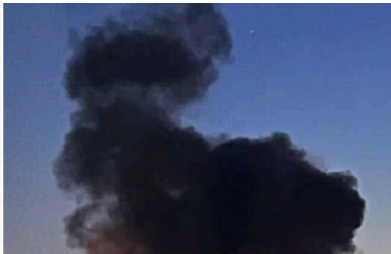
У Дніпрі пролунав вибух: ППО збила ворожу ракету

У Дніпрі під час повітряної тривоги пролунав вибух. Перед цим Повітряні сили попереджали про ракетну небезпеку.