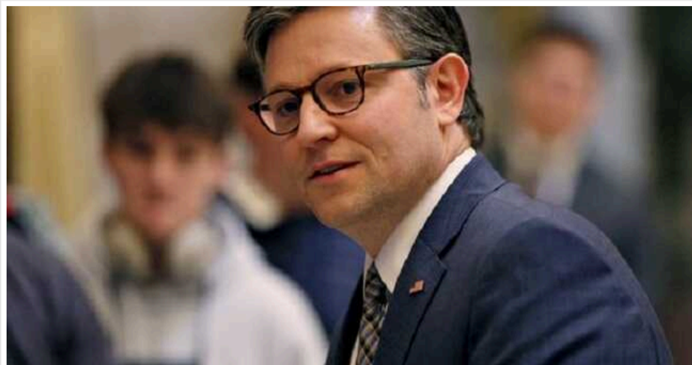
Спікер Конгресу США Джонсон розкритикував законопроект щодо кордону, який розглядається у Сенаті: цей закон має зняти блокування з грошей для України

"Пропозиція Сенату, що знаходиться на розгляді, прямо дозволяє до 150 000 незаконних переходів щомісяця (1,8 мільйона на рік), перш ніж можна буде використувати будь-які нові повноваження щодо "закриття" (кордонів – Ред.). До цього моменту Америка вже буде здана", – сказав Джонсон.