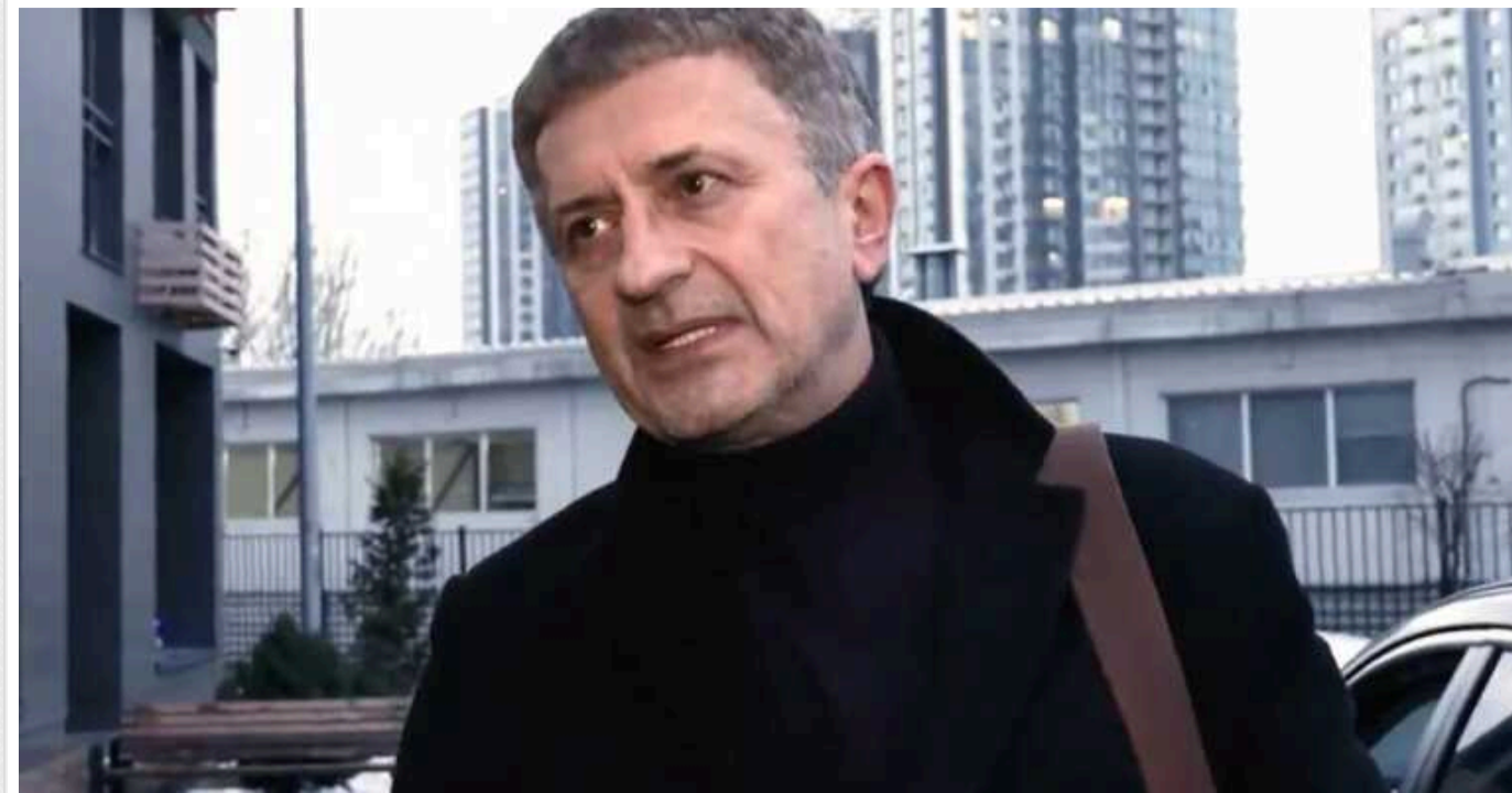
Учораšní обшуки у новій справі про розкрадання у Міноборони: причетний український політик Юрій Збітнєв

Він був одним із наймолодших депутатів першого скликання Верховної Ради.