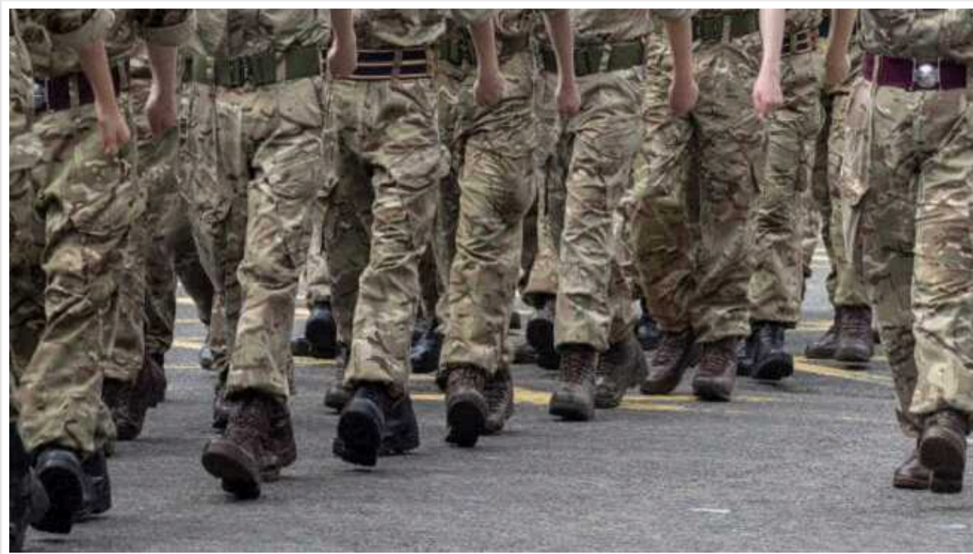
Третина британців молодших за 40 років відмовилася б від призову у разі нападу на Велику Британію, – опитування YouGov

У Великій Британії 38% людей молодших за 40 років стверджують, що вони відмовилися б служити у збройних силах у разі нової світової війни, а 30% відповіли, що не служили б, навіть якби на їхню країну напали.