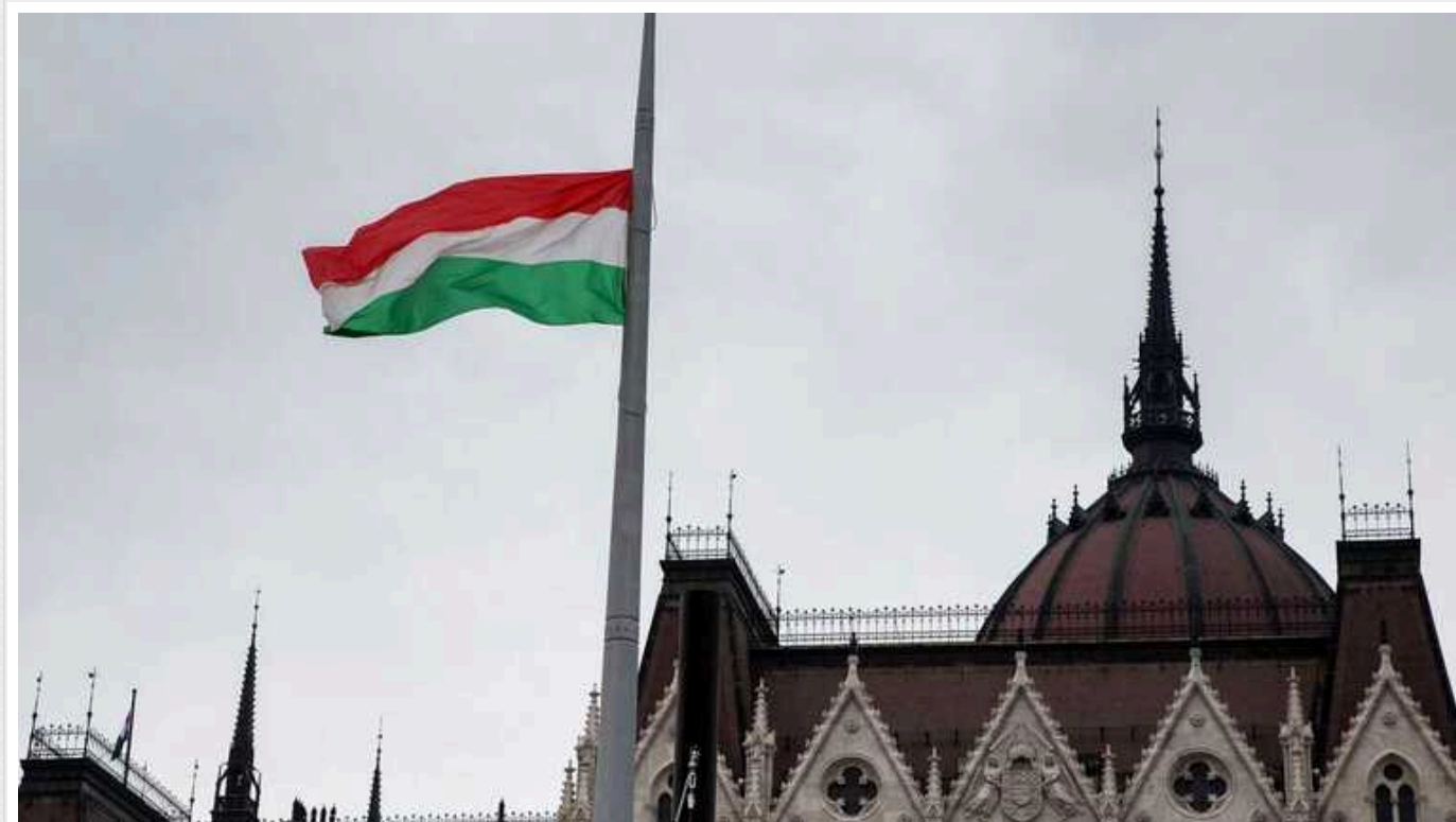
В Угорщині відмовилися засудити КНДР за постачання зброї Росії

Угорщина не засудила постачання Північною Кореєю зброї Росії у війні проти України, як це зробили практично всі інші члени ЄС, бо «не отримала жодних доказів».