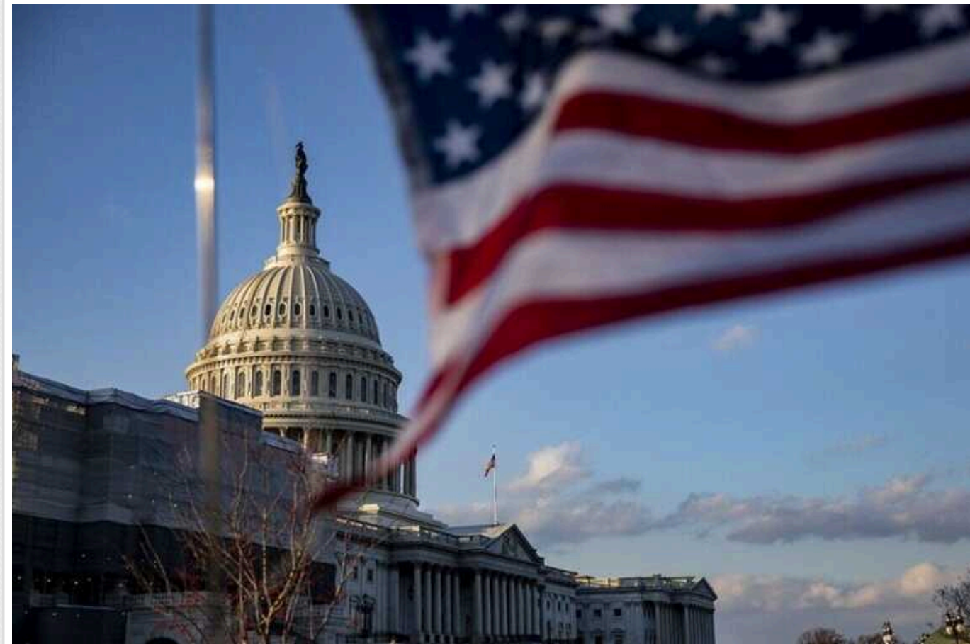
ISW: Росія розгорнула інформаційну кампанію у США, щоб зірвати допомогу Україні

Росія намагається маніпулювати внутрішньополітичними подіями у США, щоб завдати дебатам щодо подальшої військової допомоги Україні.