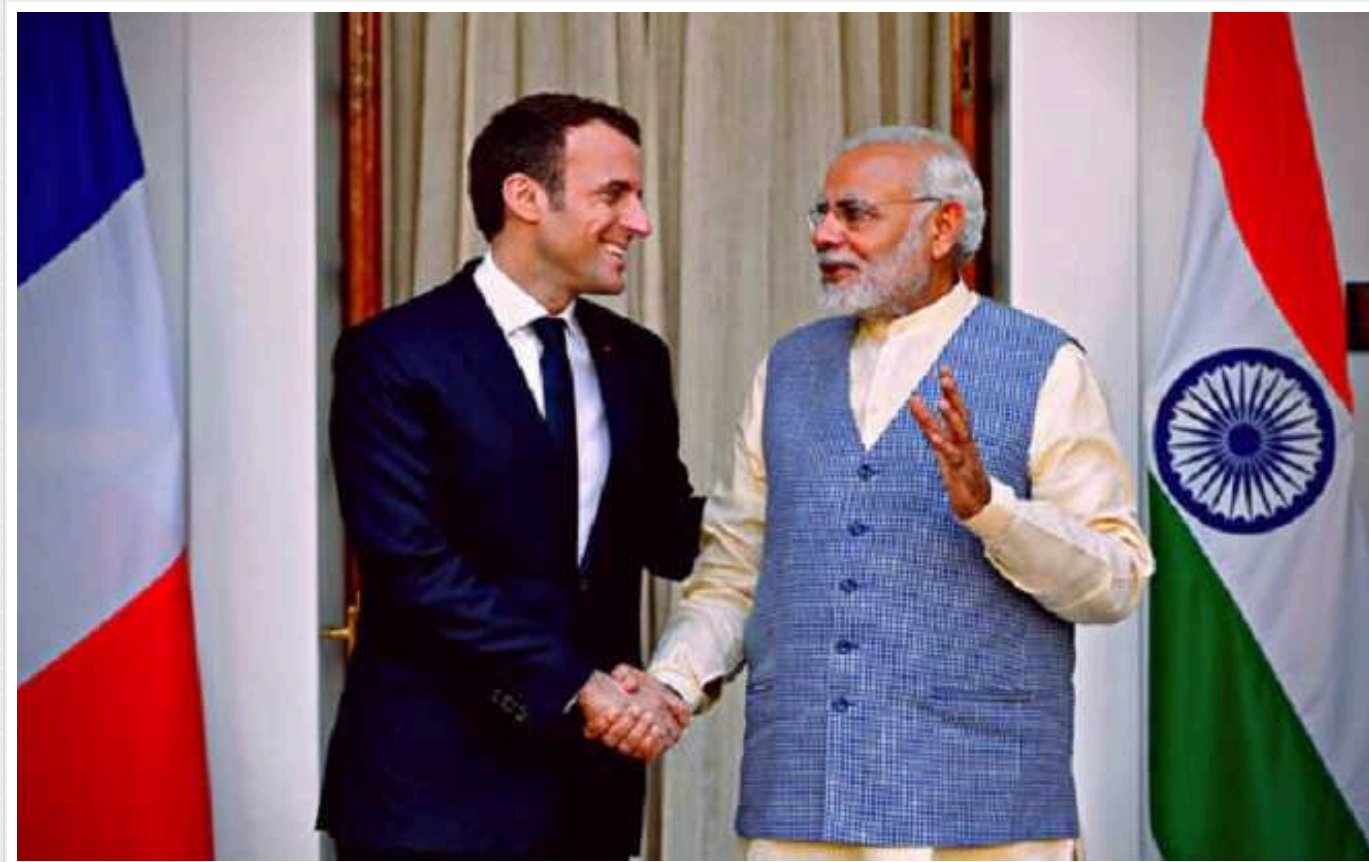
Франція та Індія домовилися про спільне виробництво підводних човнів та гелікоптерів

Індія та Франція домовилися про спільне виробництво військової техніки, включаючи гелікоптери та підводні човни для індійських збройних сил, а також дружніх країн.