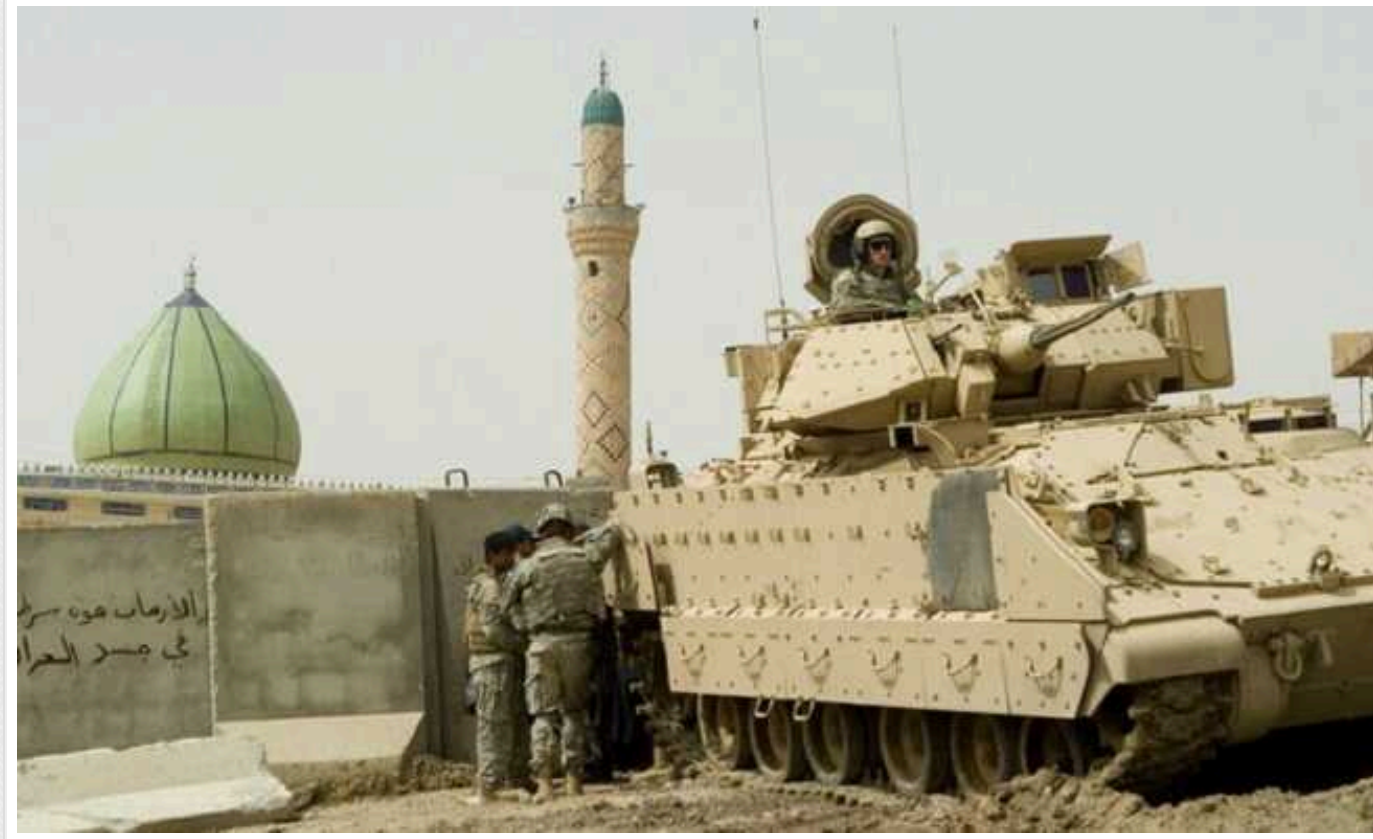
США та Ірак обговорюють завершення військової місії Білого дому

Сполучені Штати Америки та Ірак провели в Багдаді перший раунд переговорів, спрямованих на згортання місії військової коаліції, яку очолює Білий дім, для боротьби з терористичним угрупованням "Ісламська держава".