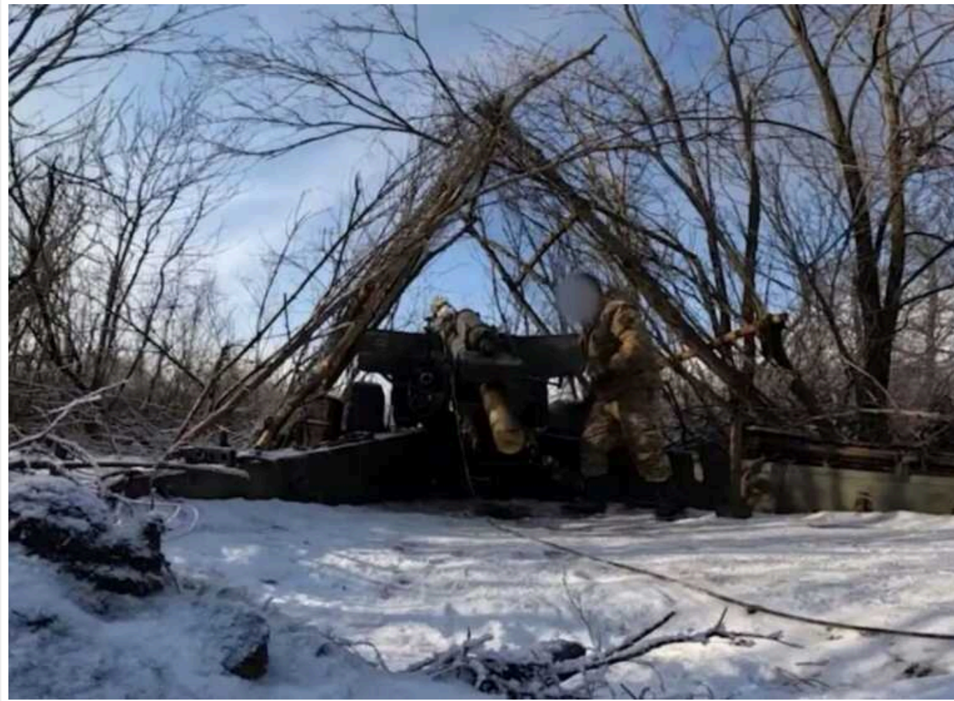
Окупанти почали застосовувати в боях проти ЗСУ гармати 1950-х років

Війська країни-агресора Росії почали застосовувати в боях проти Сил оборони України радянські 130-міліметрові гармати М-46. Ці гармати в СРСР виготовлялись з 1946-го по 1950-й роки.