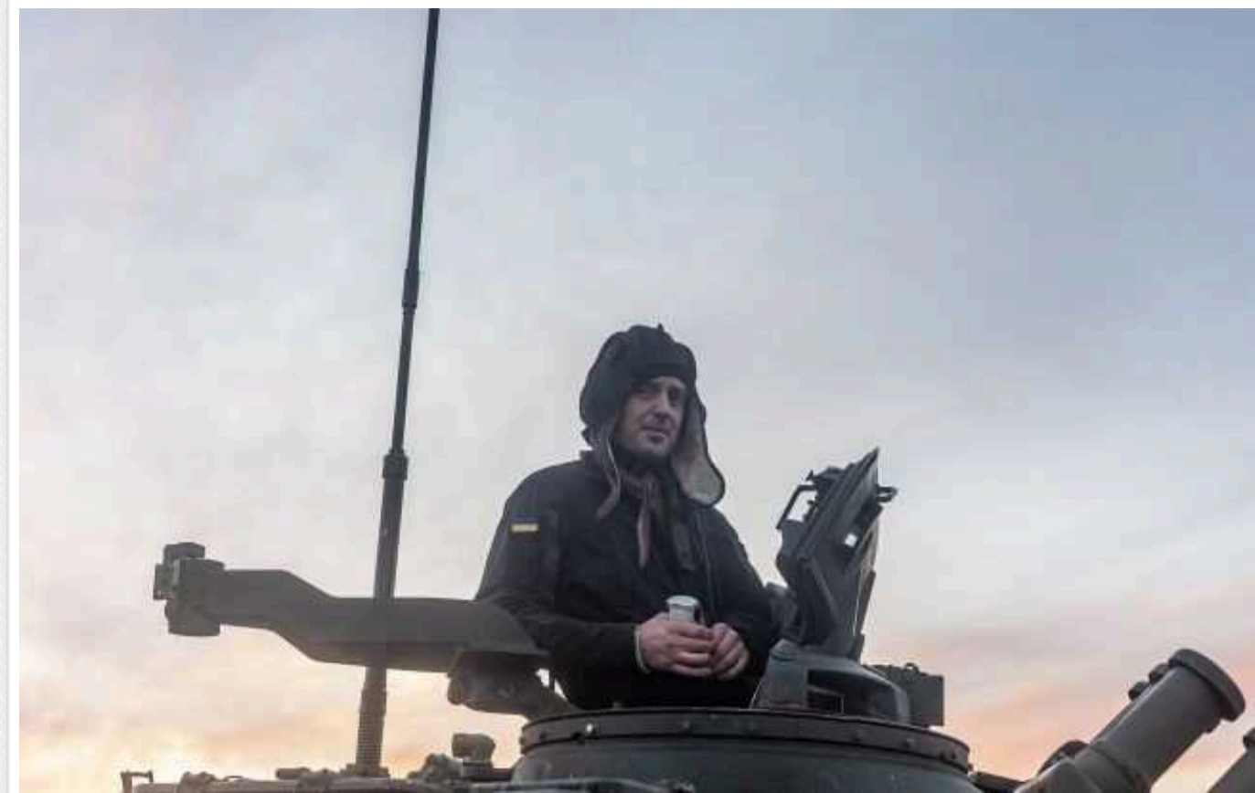
Окупанти посилили тиск на Куп'янському напрямку: карти боїв від ISW

Російська окупаційна армія збільшила темп наступальних операцій у Харківській області. Зокрема, на Куп'янському напрямку ворог проводить атаки на північний схід від районного центру.